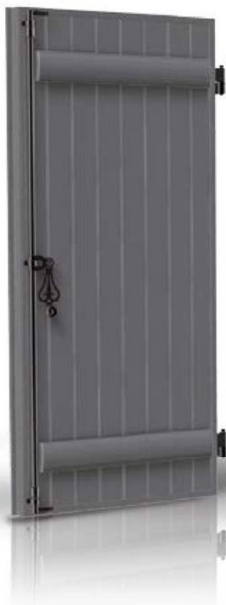
Barres et écharpe.