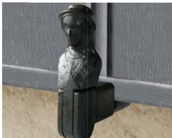
Arrêt tête de bergère en composite (avec butées) en option.