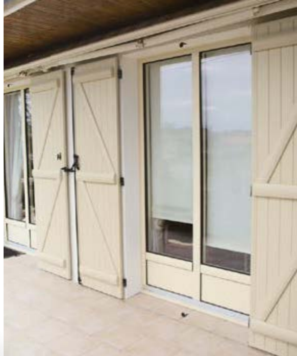
Volets en configuration Barres et écharpe en coloris RAL 1015, ferrage en noir.