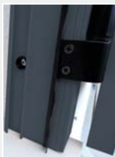
Vérin de pose