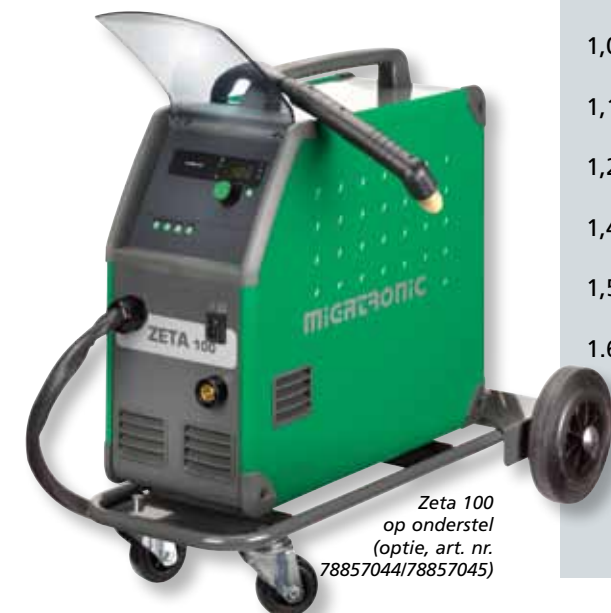
Zeta 100 op onderstel (optie, art. nr. 78857044/78857045)