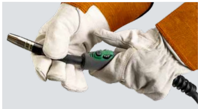
Toortshandvat met een ergonomische, 360 graden draaibare zwanenhals