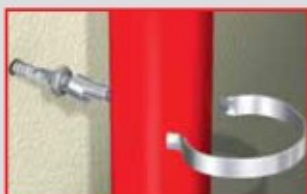
Beugel openbuigen en om de buis dichtbuigen.