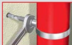
Moer vastdraaien.... Klaar!