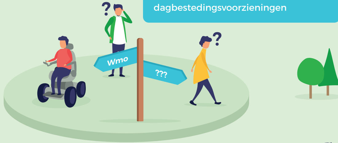
De ontwikkeling van het aantal Wmo-meldingen*