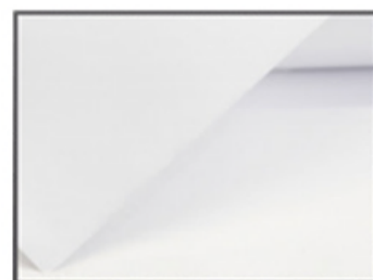
PVC 28/100 ÈME M1