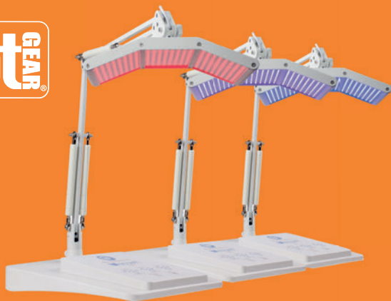
bt-accent ® LED Rot, Blau, & Kombination LED