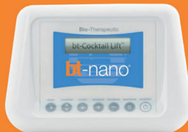
bt-nano ® Mikrostrom Technologie