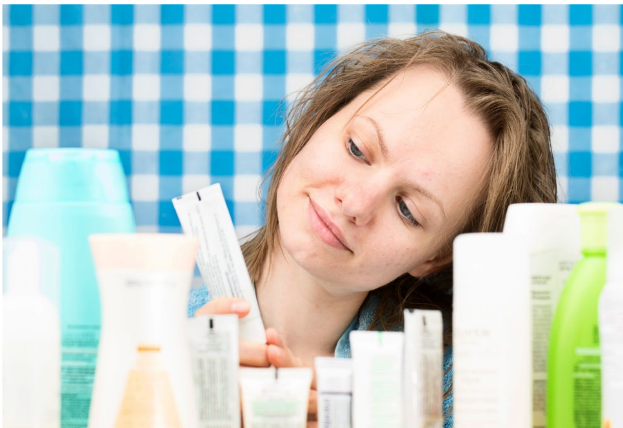
Junge Kunden sind experimentierfreudig, offen und an innovativen Produkten interessiert.

JUNGE KUNDEN ANSPRECHEN – Teenies, die Sie heute mit Ihren Behandlungen begeistern, sind Ihre Stammkunden von morgen. Also ran an diese interessante und zukunftssträchtige Zielgruppe!