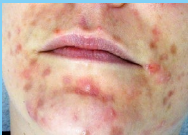
Medizinisch gesehen ist die Kratzakne bei den „Skin Picking Disorder“-Erkrankungen einzuordnen.