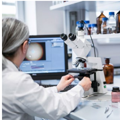
Emulsionssysteme, die den Hydrolipidmantel umgehend aufbauen und intakt halten und der Haut helfen, sich wieder effektiv selbst zu schützen, sind das Ergebnis jahrzehntelanger Forschungsarbeit.