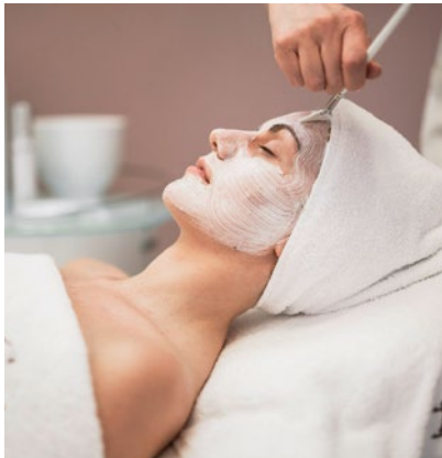
Eine Pflegeempfehlung für eine stabile Hautbarriere ist, Serum und Creme immer in Kombination anzuwenden.