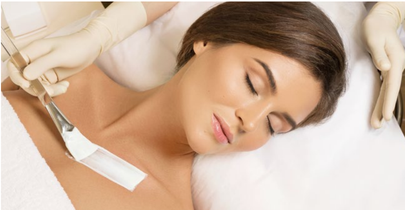
Sie können im Institut zum Beispiel ein Treatment für ein straffes Dekolleté anbieten.

aus mit ihrer Kundin teilen können. Des Weiteren stehen uns im Institut auch ohne Body Treatments eine Vielzahl von möglichen „Mini-Treatments“ inklusive Zusatzverkäufen zur Verfügung.