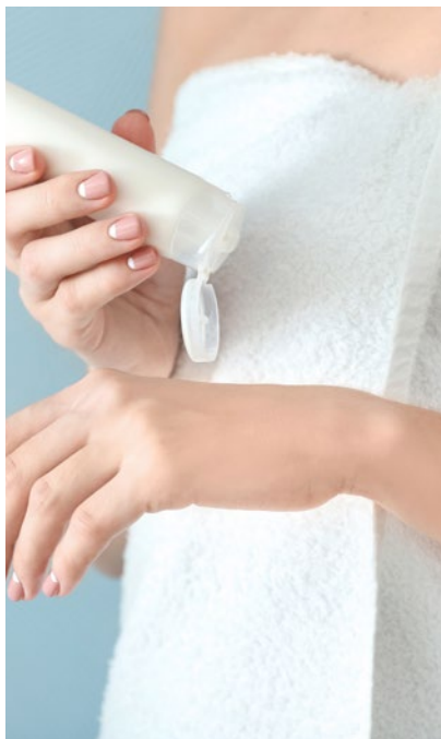
Zur Rückfettung nach dem Duschen eignen sich reichhaltige Körperlotionen und -cremes mit Moisturizern.