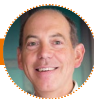
Wellnesstrainer im Kurland Training Center

„Unter dem modernen Namen Cupping (engl. für Schröpfen) erlebt das traditionelle Schröpfen gerade einen neuen Hype . Das liegt daran, dass die Gäste Wellness heutzutage nicht nur als reine Entspannungsmassnahme sehen, sondern oft auch eine präventive und gesundheitsfördernde Behandlung verlangen. Und genau das ist es: Das Schröpfen sowie die etwas angenehmere Schröpfkopfmassage wirken entgiftend, entschlackend und stoffwechselaktivierend und stimulieren das Immunsystem und die Selbstheilungskräfte. Das Prinzip dahinter ist ganz einfach: Kleine Schröpfgläser auf der Haut erzeugen einen Unterdruck, regen die Durchblutung an und können so Verspannungen lösen so-