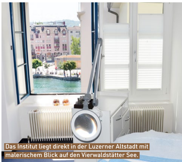
Das Institut liegt direkt in der Luzerner Altstadt mit malerischem Blick auf den Vierwaldstätter See.