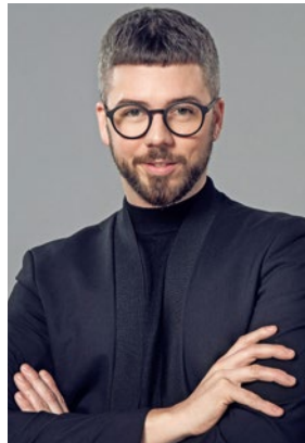
Martin Dürrenmatt stylte das Covergirl in Braun- und Naturtönen, um den Summerglow zu unterstreichen.

Martin Dürrenmatt/Rolph AG | Star-Coiffeur Martin Dürrenmatt eröffnet im September sein eigenes „Hair Atelier“ in Zürich. Ausserdem gibt der Coiffeur in Kooperation mit der Rolph AG in deren Extensions Academy Workshops zum Thema „Glamour und Traumhaar für jede Frau“.