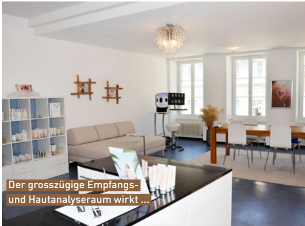
Der grosszügige Empfangs- und Hautanalyseraum wirkt ...