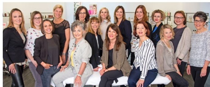
Das motivierte und gut aufgestellte Team von Musculus Cosmetics AG freut sich auf weitere erfolgreiche Jahre.