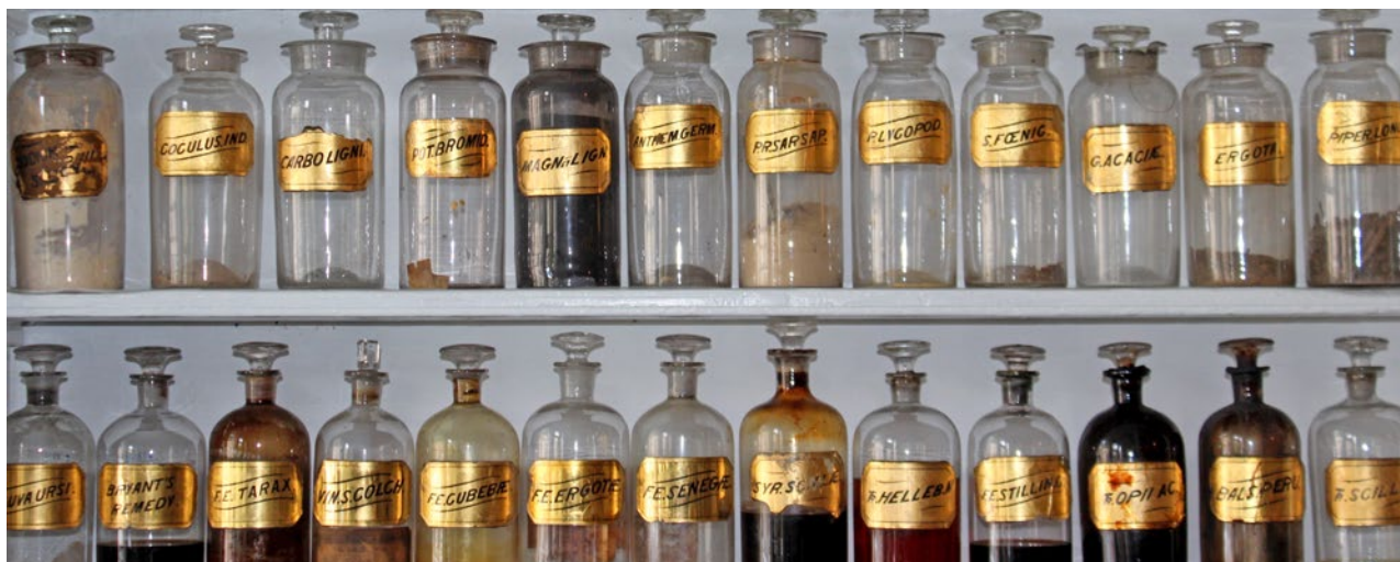
Die Herstellungsweise von ätherischen Ölen gleicht der der Alchemie – von Hagebutten- bis Teebaumöl können Pflanzen zum Öl destilliert werden.

In der Naturkosmetik werden daher die ätherischen Öle immer mit dem hauttypentsprechenden Pflanzenöl vermischt. Diese Mischung stellt eine ausgesprochen interessante Synergie dar, da sie mit der Liposomen-Technik verglichen werden kann. Die Wirkstoffe können dank diesem Zusammenspiel bis in die tiefen Hautschichten gelangen, um dort effektive hautregenerierende und faltenglättende Wirkungen zu erzielen.