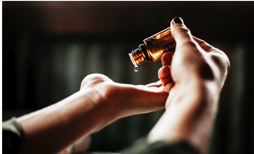
Träufelt man ätherische Öle auf die Haut, verströmen sie sofort einen sinnlichen Duft im Raum.

In diesem Verfahren werden zuerst die ätherischen Öle durch einen Wasserdampf aus den Pflanzen gelöst. Dieser Dampf wird wieder ge-