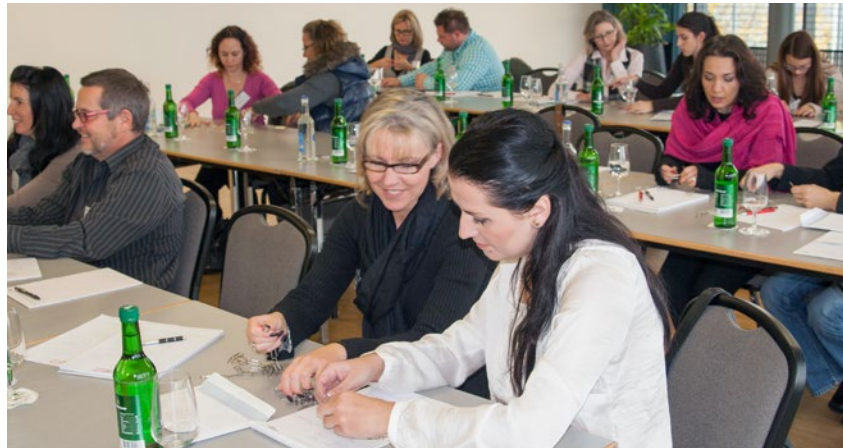
Mitglieder des Fachverbands profitieren unter anderem von exklusiven Weiterbildungen.

Im Zeitalter von Social Media ist die Naildesignerin ständig neuen Trends und Informationen ausgesetzt. Auch hier unterstützt der Verband seine Mitglieder regelmässig mit abgeklärten Hintergrundinformationen und