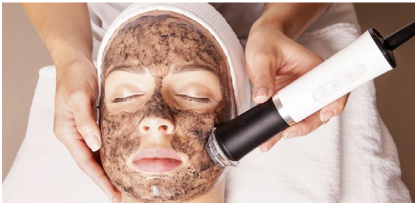
Für eine 75-minütige Gesichtsbearbeitung mit Geräteanwendung kann je nach Region 180 bis 250 Franken verlangt werden.

Wenn Sie sich für ein Produkt entschieden haben, gilt es, einen seriösen und erfahrenen Anbieter zu finden. Kaufen Sie nur Originalgeräte, die in der Schweiz zugelassen sind. Bleiben Sie standhaft, auch wenn die Versuchung gross und der Preis verlockend ist. Falls möglich, besuchen Sie den Lieferanten vor Ort und machen Sie sich ein Bild über das Unternehmen. Lassen Sie sich persönlich beraten und testen Sie das Gerät. Achten Sie zudem auf die Serviceleistungen nach dem Kauf und die Schulungsangebote für Mitarbeitende. Werden diese Leistungen angeboten, und was ist im Kaufpreis inbegriffen? Informieren Sie sich auch über den Ablauf bei Reparaturen. Wohin müssen Sie das Gerät schicken oder bringen oder wird es bei Ihnen vor Ort abgeholt? Diese