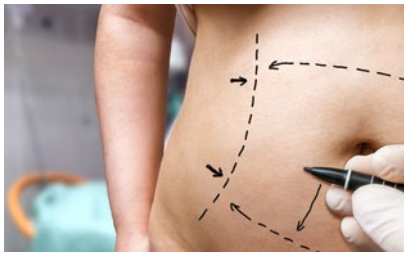
Ein „Tummy Tuck“ kann überschüssige Haut und Fett entfernen, straffen und die Bauchmuskeln wiederherstellen.

Wenn massives Übergewicht zu einer Überdehnung der Bauchdecke geführt hat, verbleibt nach Gewichtsabnahme eine deutliche Fettschürze. Erschlaffte Haut, Dehnungsstreifen und schwache