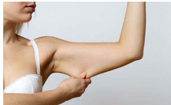
Bei einer Oberarmstraffung wird überschüssige herabhängende Haut an den Oberarmen („Winkearme“) entfernt und so ein Straffungseffekt erzielt.