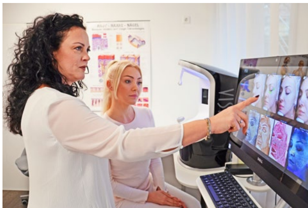
In Geräte hat die Kosmetikerin 150.000 Euro investiert. Hier zu sehen ist ein "Visia Hautanalyse"-Gerät.