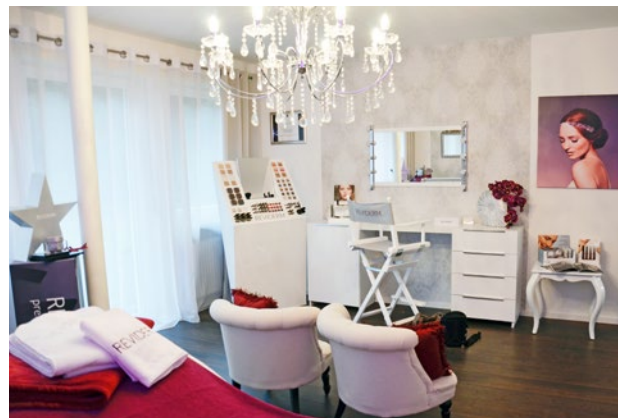
Im zweiten großen Behandlungsraum gibt es auch einen Style-Bereich. Hier bietet die gelernte Pigmentistin auch Visagistik an.

Zwecken Blut abnehmen. So kann sie direkt im Institut untersuchen, warum manche Hautzustände aus dem Inneren heraus zustande kommen.