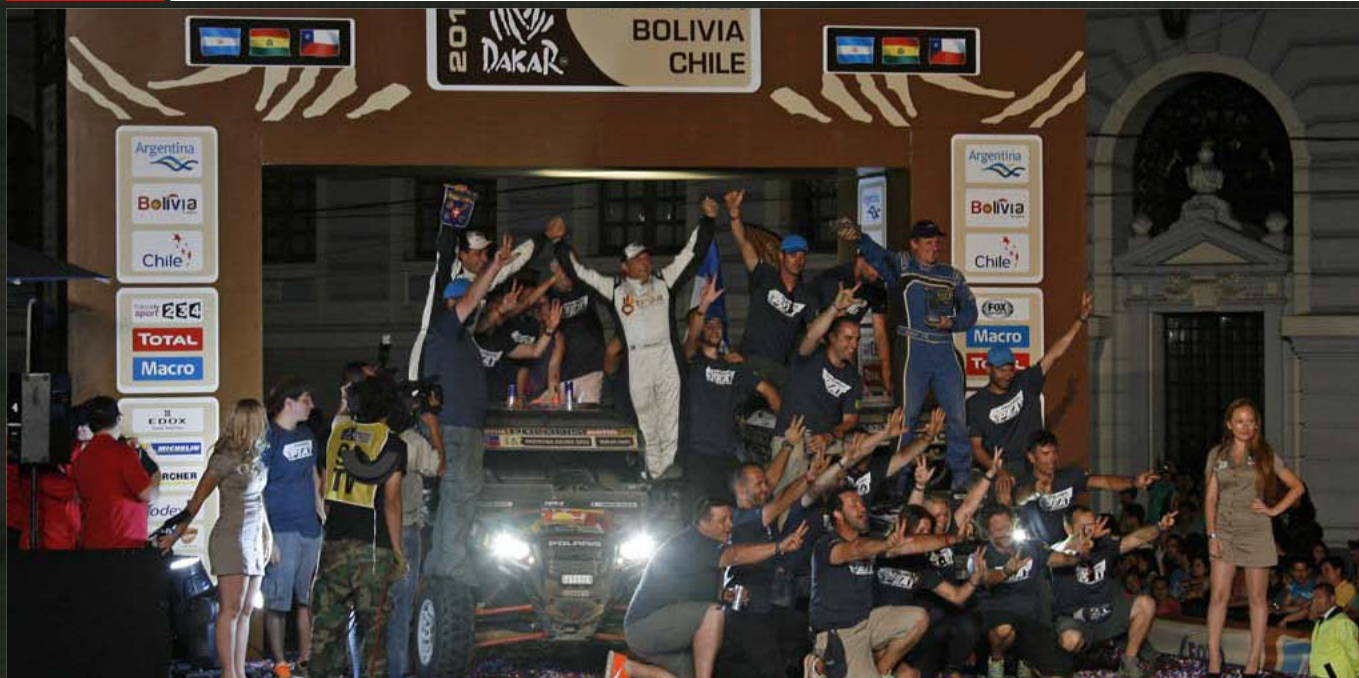
Xtrem Plus Polaris Factory team / Polaris RZR

Round 01 02 03 04 05 06 07 08 09 10 11 12 13