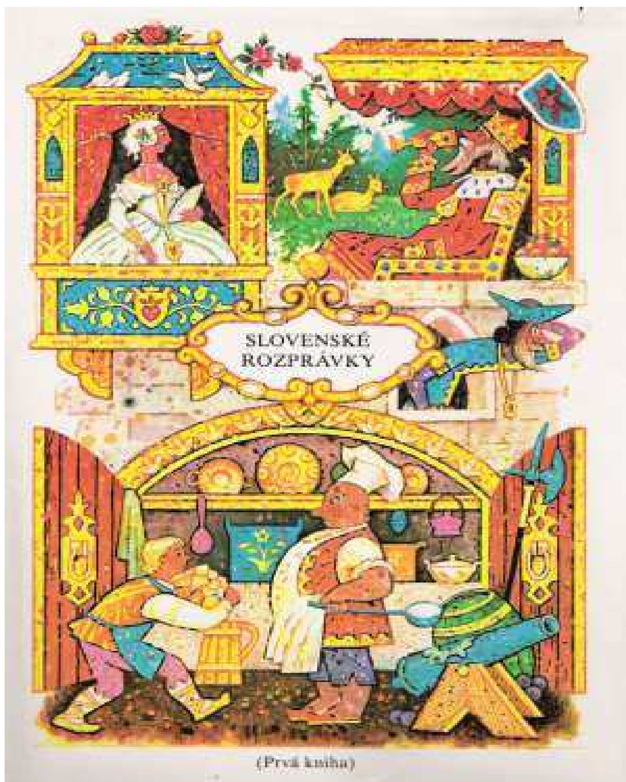
Slovenské ľudové rozprávky, P. Dobšinský ilustroval Ľudovít Fulla.