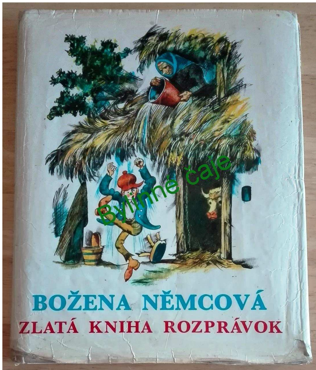
Zlatá kniha rozprávok, Božena Němcová a ilustroval Štefan Cpín.