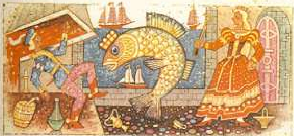
Slovenské ľudové rozprávky, P. Dobšinský ilustroval Ľudovít Fulla.