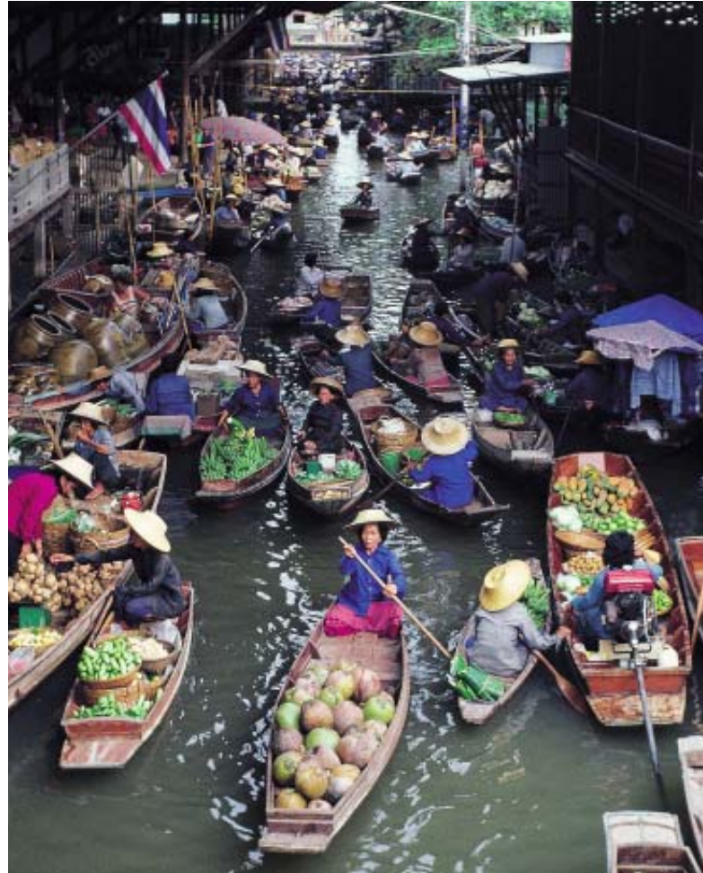
Thailandia, Damnoesaduak Mercato galleggiante

Viaggi riservati a piccoli gruppi pensati e progettati con le stesse attenzioni e la stessa cura che da sempre poniamo per i nostri viaggi individuali su misura.