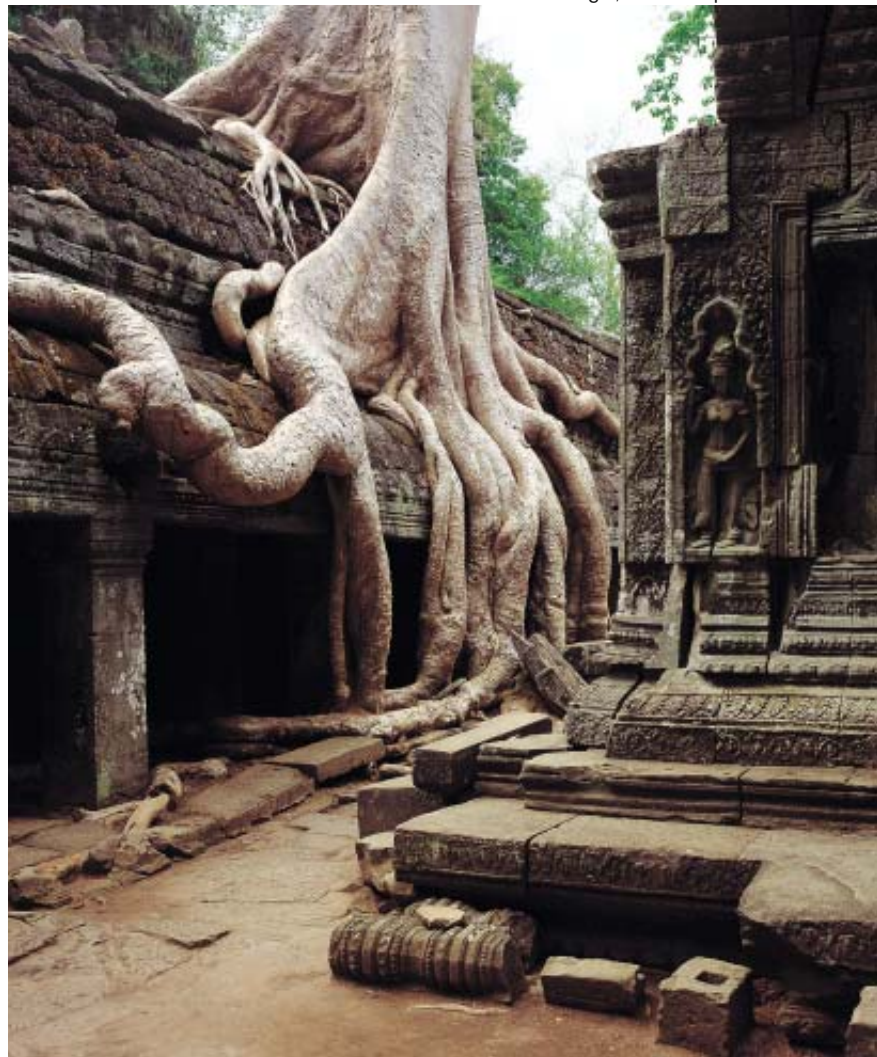
Cambogia, Siem Reap Ta Prohm

Il Vietnam è un paese piacevole da visitare che sorprende il viaggiatore per la cordialità della sua gente, la sua atmosfera coloniale, il contrasto tra la vita frenetica delle città e la tranquillità delle campagne, pittoresche cittadine colme di templi, pagode e case coloniali, bellezze naturali quali la baia di Halong o il delta del Mekong. Luoghi che coinvolgono il viaggiatore in un lento e continuo scorrere d'immagini e sensazioni che si perdono in una percezione dello scorrere del tempo dilatata. Il Vietnam vanta una straordinaria civiltà millenaria, di cui si ha testimonianza in molteplici siti e monumenti disseminati in tutto il paese dai templi di Hanoi alla città imperiale di Hue, ma anche influenze risalenti alle varie colonizzazioni che si sono susseguite nel corso della storia offrendo così un fascino frutto della mescolanza tra culture orientali ed occidentali. A Saigon come in altre metropoli asiatiche, accanto a grattacieli ultramoderni sorgono diversi mercati, pagode, templi ricchi di storia e fascino. Viaggiare in Cambogia è come viaggiare in un'altra dimensione, in mezzo ad una natura autentica, allo stesso tempo dolce e selvaggia. Il maestoso complesso di Angkor è testimonianza della grande civiltà Khmer, che un tempo dominava su tutta l'Indocina.