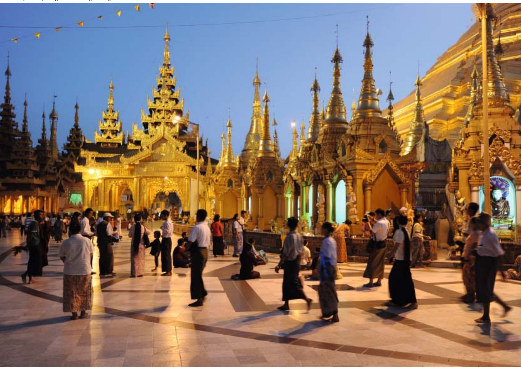
Myanmar, Yangon Shwedagon Pagoda