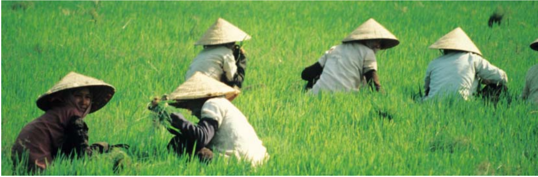
Vietnam, Chau Doc Mondine nelle risaie