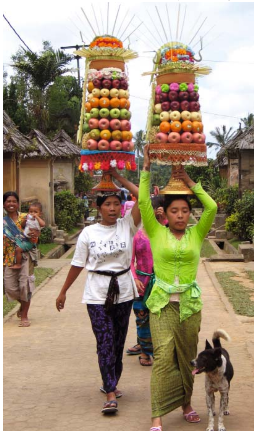
Indonesia, Bali Offerte al tempio

Un viaggio alla scoperta di Bali, un'isola affascinante e romantica per scoprire i suoi templi e le sue incantevoli risaie a terrazza quindi si raggiunge la vicina isola di Java alla scoperta di uno dei posti più incredibili di tutta l'Indonesia; il vulcano Ijen nel cui cratere nasce l'omonimo lago dal colore turchino. Il viaggio prosegue su Yogyakarta dove si trovano i due templi più importanti dell'isola; il Borobudur e Prambanan testimonianze delle religioni induista e buddista per concludersi in un meraviglioso arcipelago di ventisette atolli con spiagge bianche, acque cristalline e fondali incontaminati: l'arcipelago di Karimunjawa. Un viaggio per chi ama uno stretto contatto con la natura e per chi apprezza luoghi non ancora sfruttati dal turismo di massa.