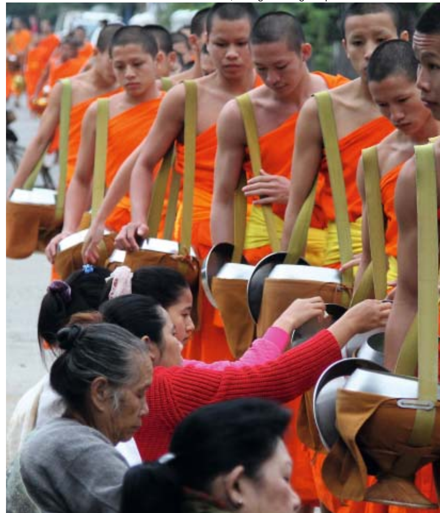
Laos, Luang Prabang La questua dei monaci

La Thailandia, primo paese del Sud Est asiatico che si aprì al turismo è una destinazione ben collaudata, pronta a soddisfare le esigenze di chi la visita. Bangkok, conosciuta come "città degli angeli", è una metropoli caotica e affascinante, capace di stupire alternando continui contrasti; di trasmettere tutto il fascino dell'antico oriente ed al tempo stesso essere museo dell'architettura moderna. La grandiosità delle antiche capitali del Siam nelle pianure centrali, su fino al nord del paese dove domina una natura rigogliosa con paesaggi mozzafiato popolati da etnie diverse che sfoggiano il fascino dei loro usi e costumi. Il Laos è un paese con forti tradizioni rurali e una profonda cultura spirituale, qui i paesaggi sono incantevoli e ovunque si avverte un'atmosfera mistica. Una terra di grande pace e serenità dove tutto si svolge con ritmi ormai dimenticati e quindi il modo migliore per visitarlo è quello di lasciarsi trasportare dalle acque della sua arteria principale; il Mekong.