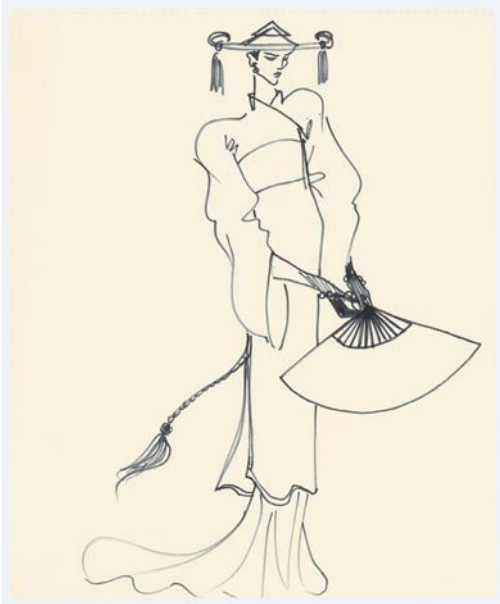
1 - Yves Saint Laurent Croquis de recherche autour du lancement du parfum Opium , vers 1977-1978 Musée Yves Saint Laurent Paris

Ces visuels peuvent être utilisés avant, pendant et jusqu'à la fin de l'exposition « L'Asie rêvée d'Yves Saint Laurent » (2 octobre 2018 - 27 janvier 2019) et uniquement dans le cadre de la promotion de cette exposition. Merci de mentionner les légendes et crédits de chaque visuel. Les fichiers en haute définition sont disponibles sur demande.