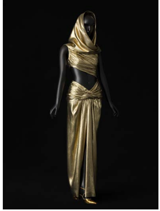
6 - Robe de soir, collection SAINT LAURENT rive gauche automne-hiver 1991