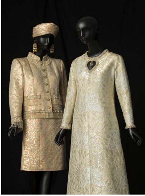
5 - À gauche : Tailleur de soir court, collection haute couture printemps-été 1982 À droite : Robe de soir long, collection haute couture automne-hiver 1969