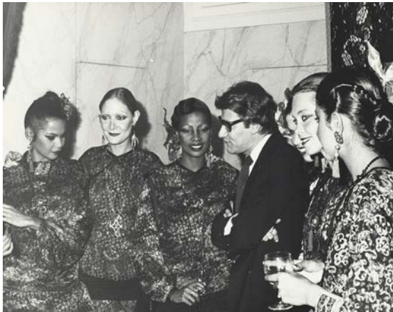
15 - Yves Saint Laurent entouré de ses mannequins lors de la soirée de lancement en France du parfum Opium , 5 avenue Marceau, Paris, 1977