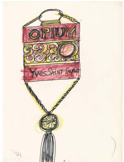
12 - Yves Saint Laurent Croquis de recherche autour du flacon du parfum Opium , vers 1977 Musée Yves Saint Laurent Paris