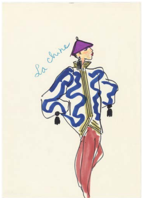
4 - Yves Saint Laurent Croquis d'illustration Musée Yves Saint Laurent Paris