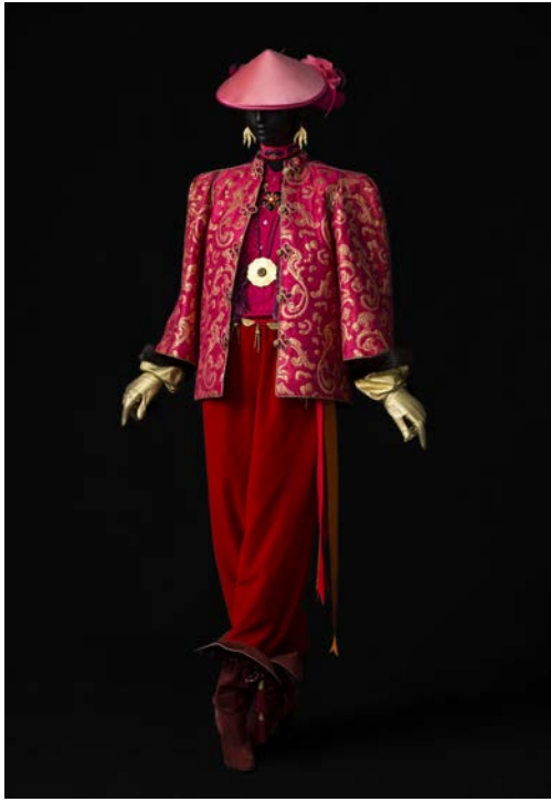
9 - Ensemble de soir, collection haute couture automne-hiver 1977