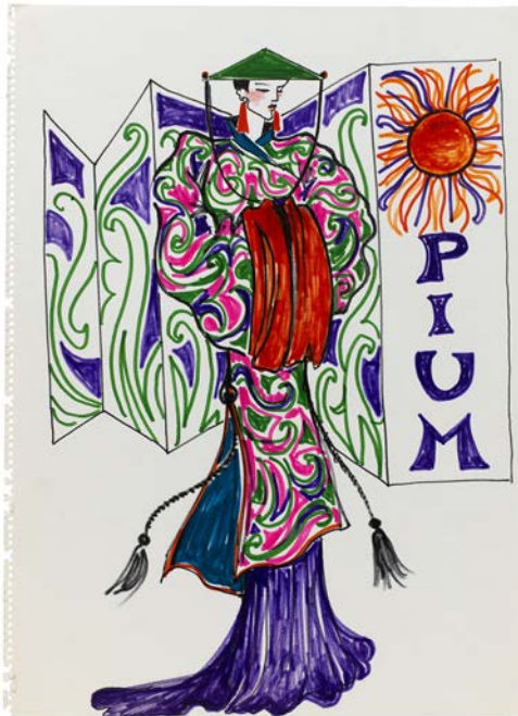
11 - Yves Saint Laurent Croquis de recherche autour du lancement du parfum Opium , vers 1977-1978 Musée Yves Saint Laurent Paris