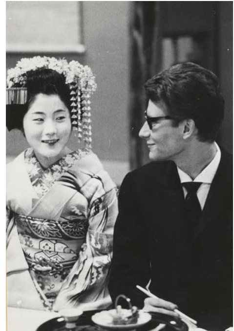
16 - Yves Saint Laurent en compagnie d'une courtisane habillée en vêtements traditionnels lors de son premier voyage au Japon, Kyoto, avril 1963