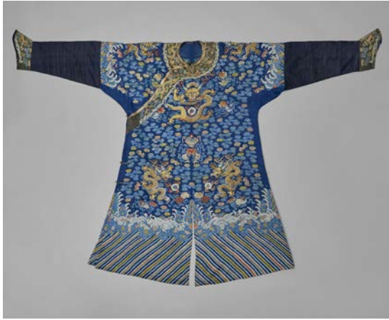
13 - Robe dragon de cour Chine, dynastie Qing, XVIII e -XIX e siècle Collection Sam et Myrna Myers