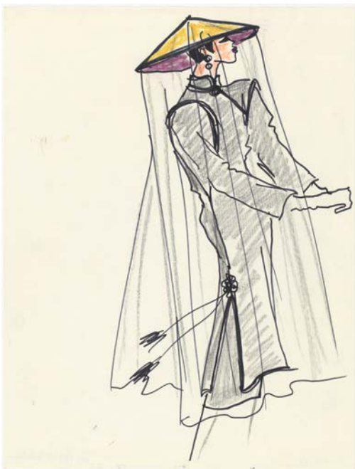
3 - Yves Saint Laurent Croquis d'illustration pour la collection haute couture automne-hiver 1977 Musée Yves Saint Laurent Paris