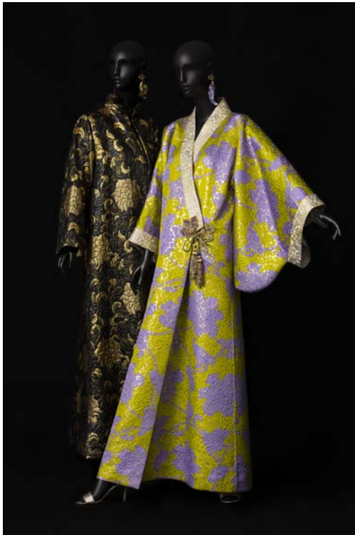
7 - Ensemble de soir, collection haute couture automne-hiver 1994