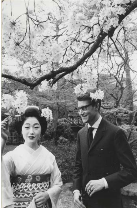
17 - Yves Saint Laurent en compagnie d'une courtisane habillée en vêtements traditionnels lors de son premier voyage au Japon, Kyoto, avril 1963