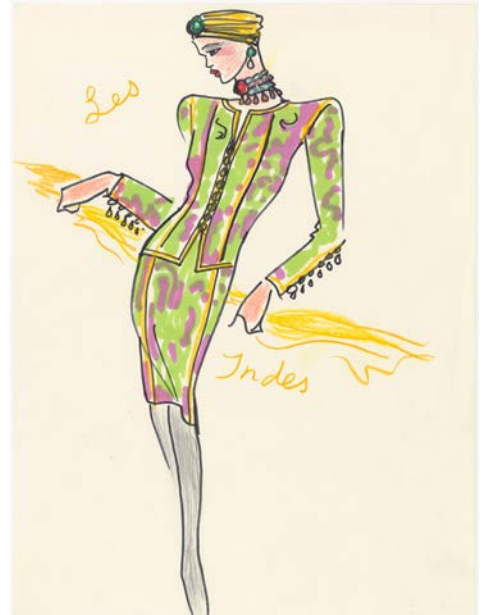
2 - Yves Saint Laurent Croquis d'illustration Musée Yves Saint Laurent Paris