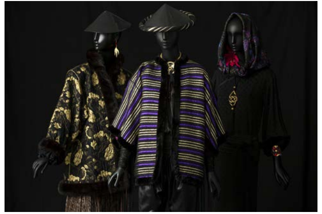
10 - À gauche et au centre : Ensembles de soir, collection haute couture automne-hiver 1977 À droite : Robe de soir, collection haute couture automne-hiver 1977