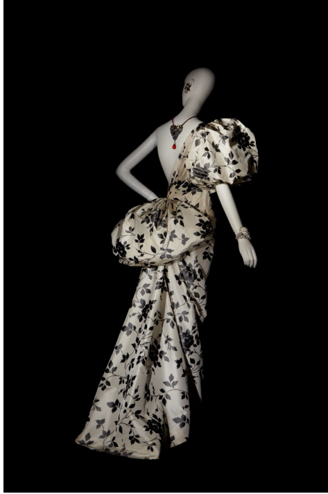
1 - Robe de soir Collection haute couture printemps-été 1986

Les fichiers haute définition sont disponibles sur demande