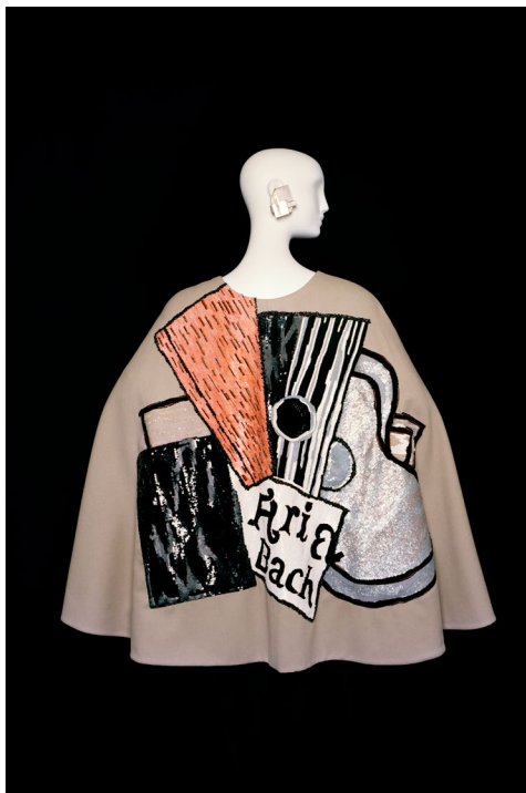
3 - Ensemble de soir long – Hommage à Georges Braque Collection haute couture printemps-été 1988 © Musée Yves Saint Laurent Paris / Alexandre Guirkinger