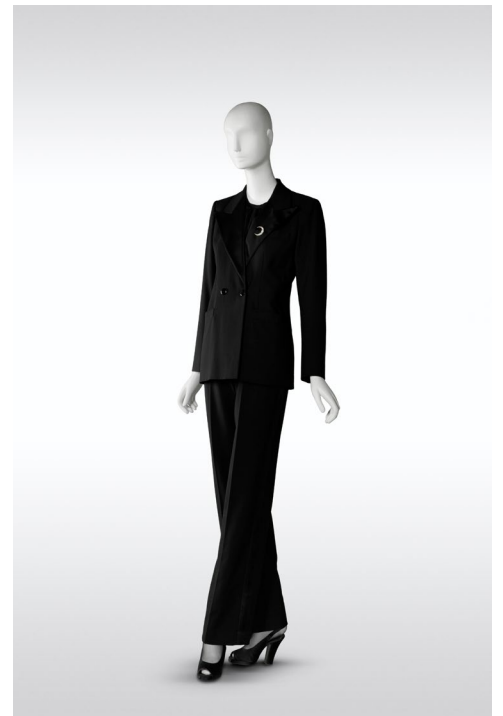
4 - Smoking Collection haute couture automne-hiver 1971