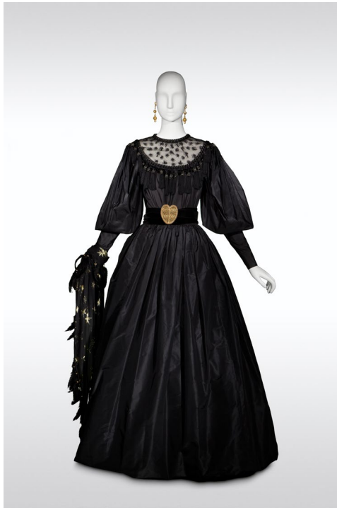
7 - Robe de soir long Collection haute couture automne-hiver 1977