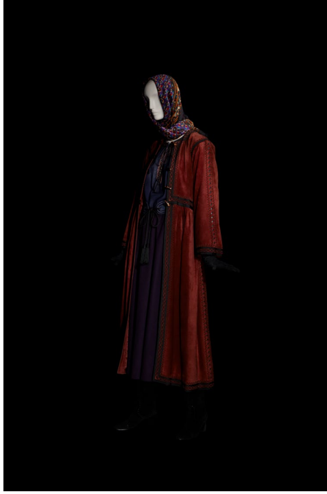
5 - Ensemble de soir Collection haute couture automne-hiver 1976