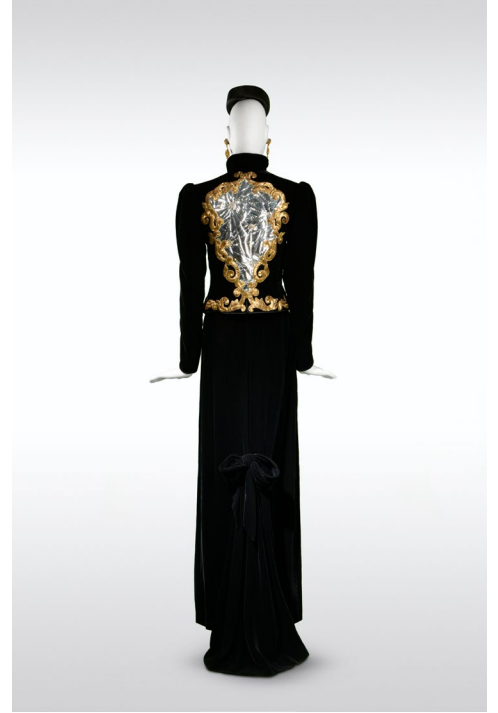
2 - Veste de soir, dite « Miroir brisé » Collection haute couture automne-hiver 1978