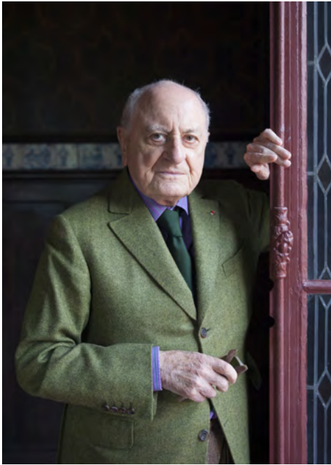
Pierre Bergé, 2013