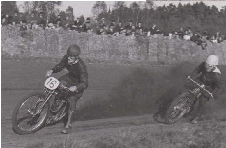
Från en "jordbanetävling" i Nässjö