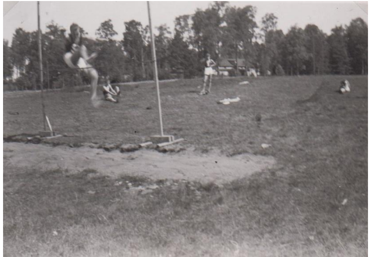
Och en och annan hoppar fortfarande saxstil.