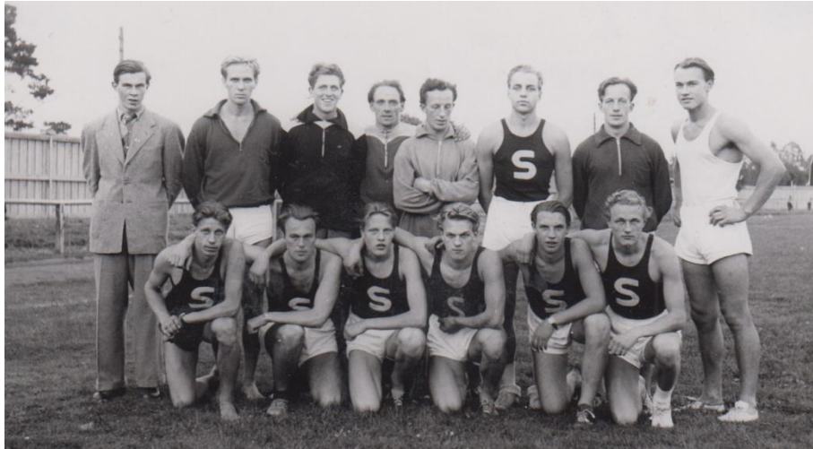
Gänget som grejat bl.a.