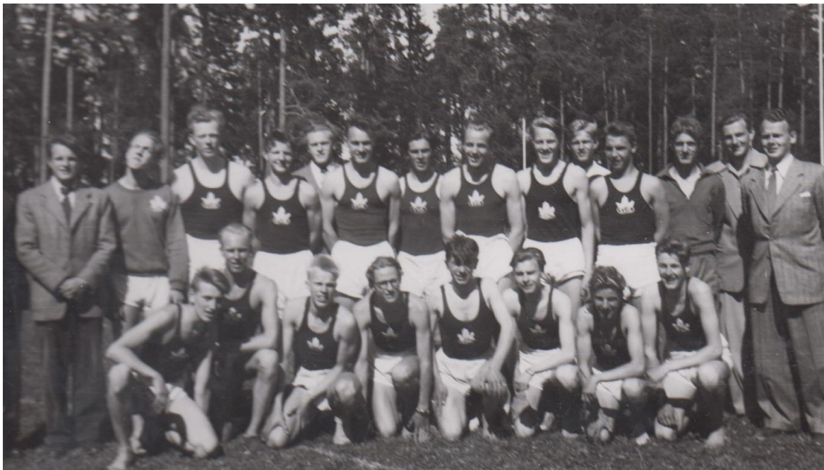
Facit från JDM blev 6 guld, 5 silver, och 5 brons !