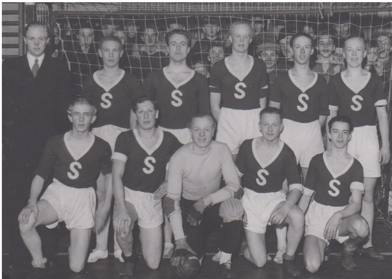
Södras framgångsrika lag vintern 1945 – 1946