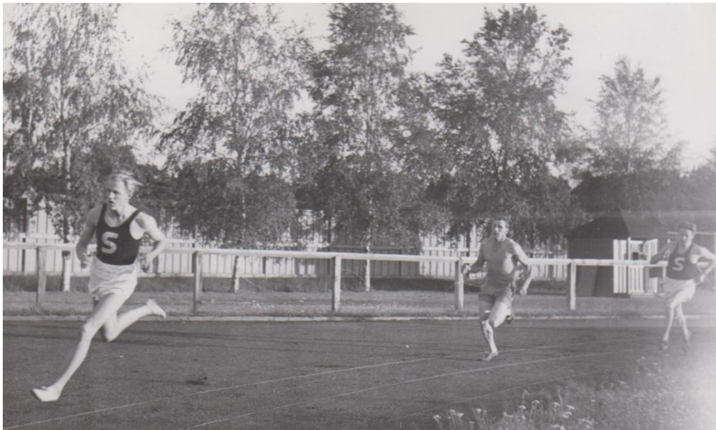
Här leder Stig Hagström på 400 meter. Bild från ett lummigt Ränneborg.