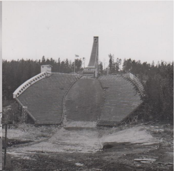
...Bjöds även på sightseeing i Oslo