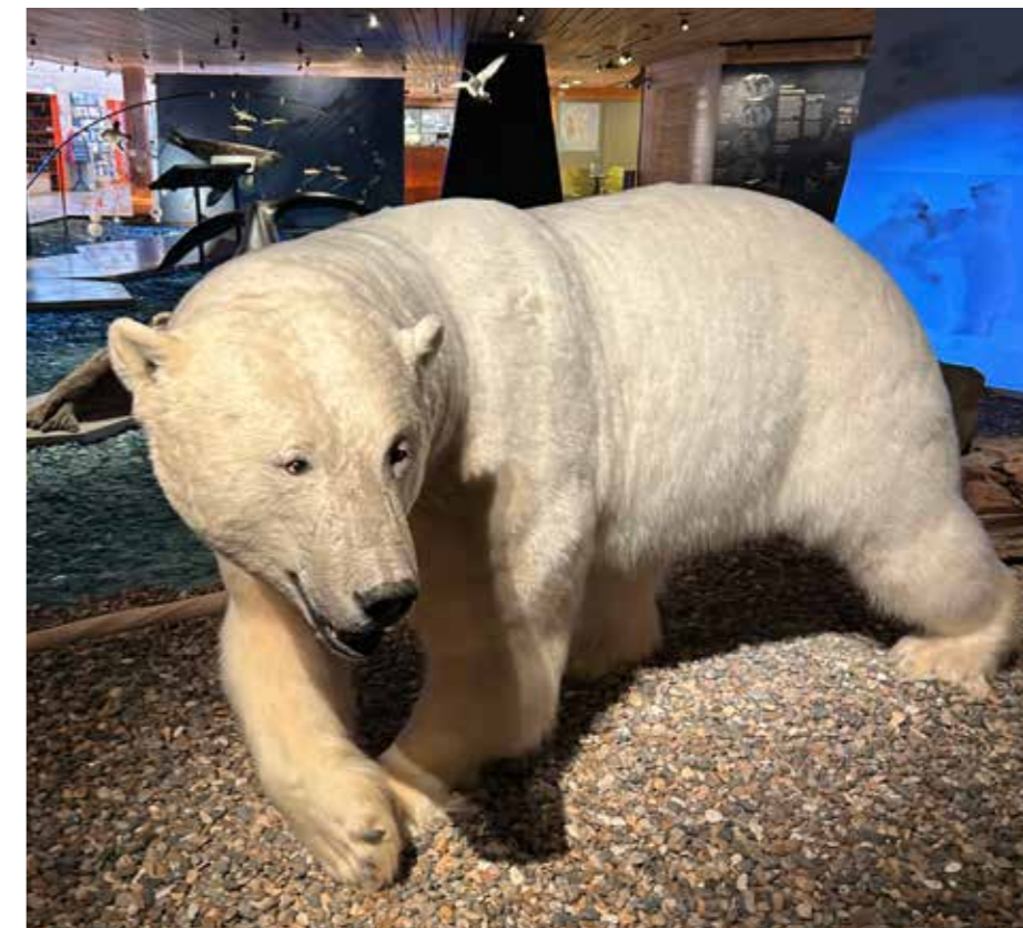
Denna björn som står på museet vägde mer än 500 kilo och blev skjuten av en forskare på bara någon meters avstånd trots att flera försökte att skrämja bort den gjorts.

En kvinna som företaget vi reste med hyrt in för att ge oss information samt guida oss på Svalbards museum var helt suverän med att redogöra för Svalbards natur och förändringar utan att vara någon hysterisk klimataktivist. Förändringarna som nu sker har skett många gånger under tidernas lopp och hennes sätt att se det var "Adapt and survive". Precis som isbjörnarna nu gjort. I och med att isarna drar sig tillbaka så har de ändrat sin föda och nu är det i stora drag vildrenar som blir mat. Renarna på Svalbard är mindre och kortbenta och tekniken är att isbjörnarna antingen jagar ned en