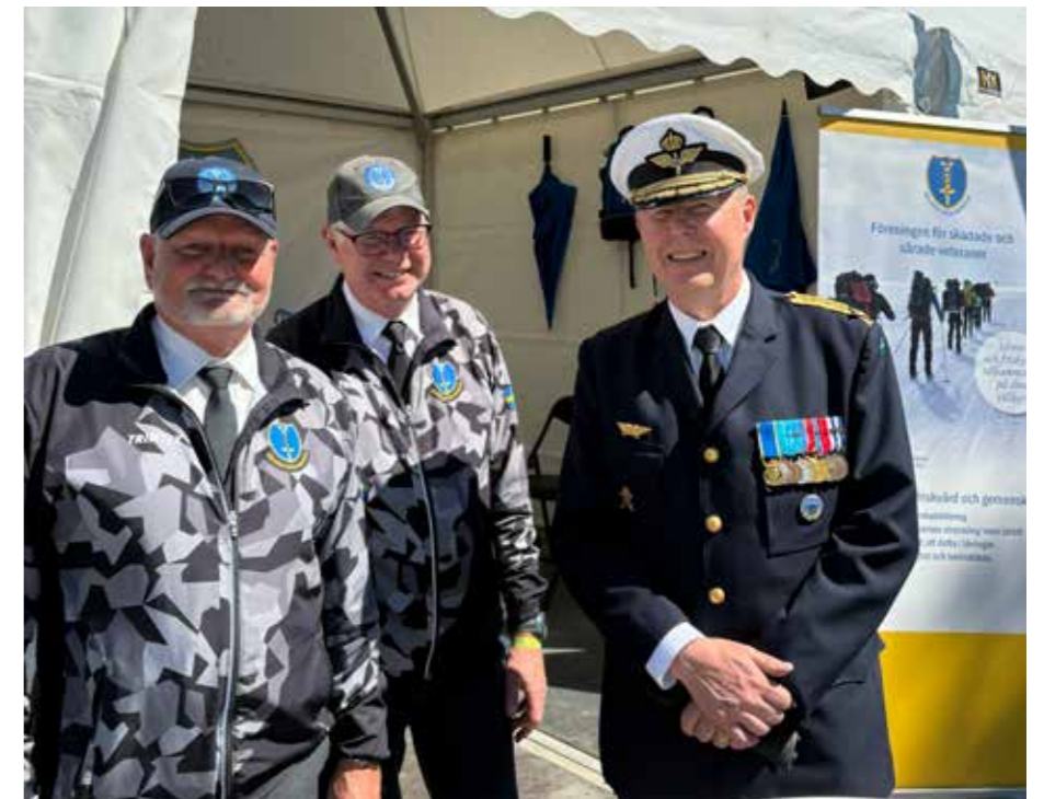
Carl-Johan Edström, generallöjtnant och chef för försvarsstaben (ovan), försvarsminister Pål Jonsson (nedan t.v.) och arméchef Jonny Lindfors (nedan t.h.) var några av de som besökte Idrottsveteranernas tält under Veterandagen.

Efter kl 17.00 packade vi ihop vår utrustning och återgick till Bosön för att förbereda vårt prova på läger under lördagen och söndagen.