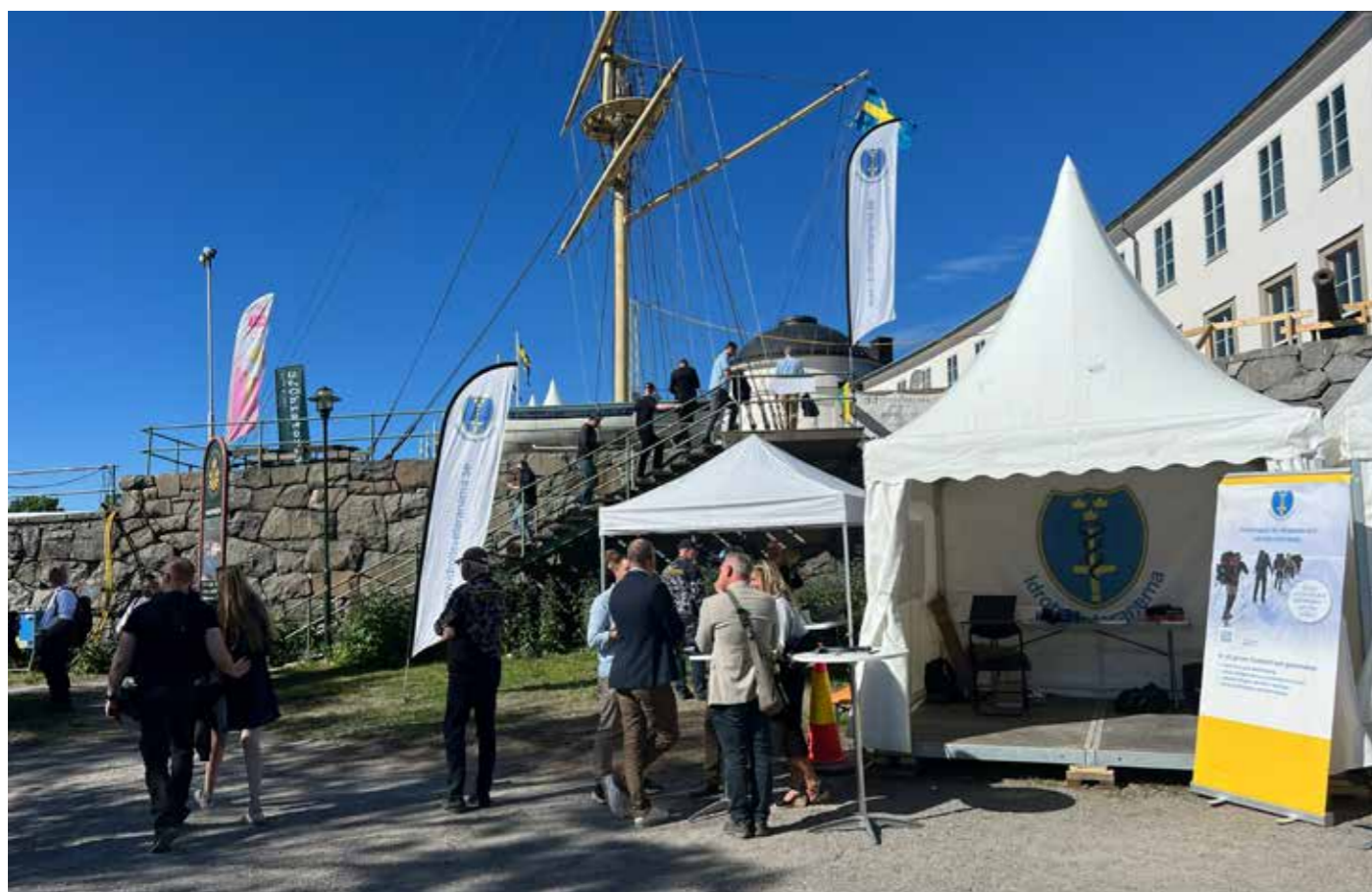
Även i år återfanns Idrottsveteranernas tält precis nedanför trappan upp till Sjöhistoriska. Här syns en lugn stund, men generellt var tälten välbesökta.