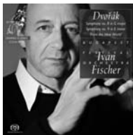
Symphony no. 8 in G major, op. 88; Symphony no. 9 in E minor, op. 95 'from the new world'

Licensed from Decca Music Group Limited, a division of Universal Music Group — original cat. no. 470 617-2