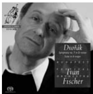
Symphony no. 7 in D minor; Suite in A major