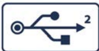
De Klas voor de Toekomst

De Klas voor de toekomst staat dit jaar op de IPON 2013 (stand B120) op de Methodeplein van de toekomst, waar de toonaangevende educatieve uitgeverijen en leveranciers zich presenteren, zoals Blink, Noordhof, OWG, Rekentuin, Onwijs software, Eduapp, De roode Kikker, Squala, Apple apps, en nog veel meer ondernemingen die innovatief lesgeven aan een klas met leerlingen.