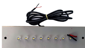
PB17 Πλακέτα φωτισμού ασφαλείας 8LED 12VDC 157mm