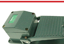
FS - 4 (365.12.010 - 365.12.020)