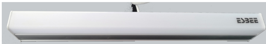
PB13 Φωτιστικό πίνακα 9W 30cm 230VAC 750lm, προστασία υπερτάσεων 2KV, χρόνο ζωής 25-30.000hrs, 0-50°C, IP20, 27cm