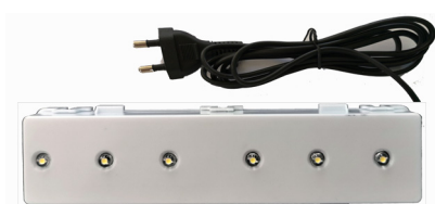
PB14 Φωτιστικό πίνακα 6LED 12VDC 157mm με μαγνήτη & καλώδιο