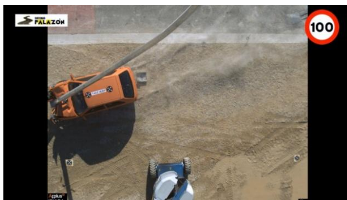
Crash test done in IIDIADA Applus