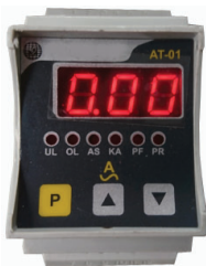
VIPS AT-01 ( 182.10.030)