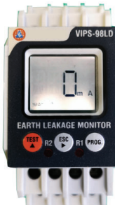
VIPS 98LD ( 182.10.035)