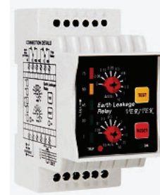
VIPS 98P ( 182.10.040)