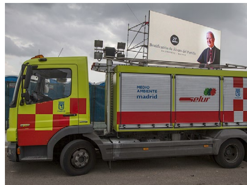
Los eventos de los días 27 y 28 no hubieran sido posibles sin la colaboración de numerosos profesionales del servicio y el orden público.