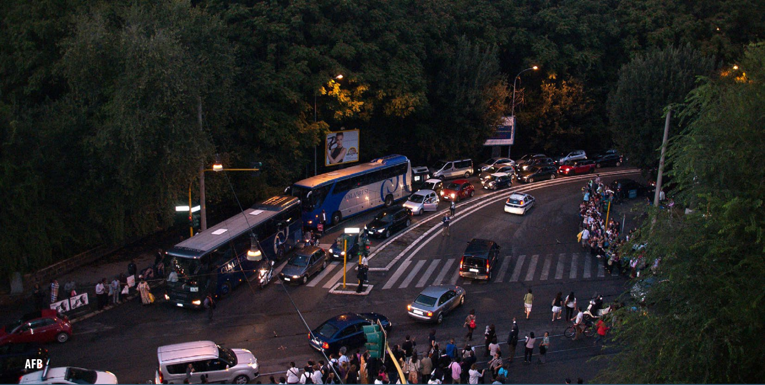
Poco después de las seis de la tarde el féretro emprende su camino por Viale Bruno Buozzi, donde se encuentra Santa María de la Paz.