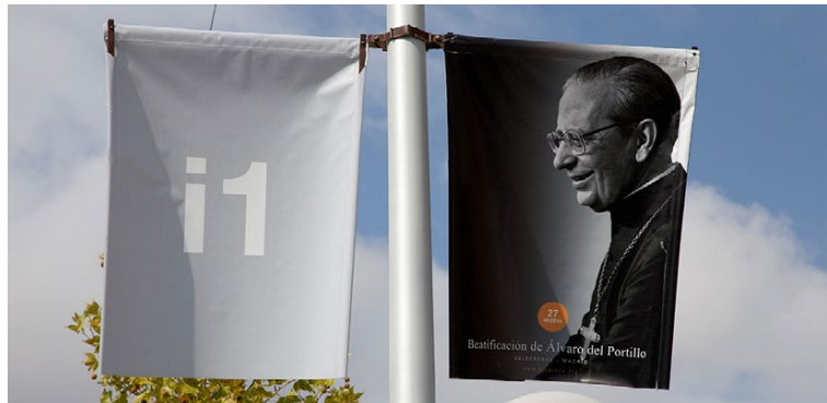
Misa de acción de gracias: unos llegaron a pie y otros en las lanzaderas que partían de las estaciones de metro más cercanas.