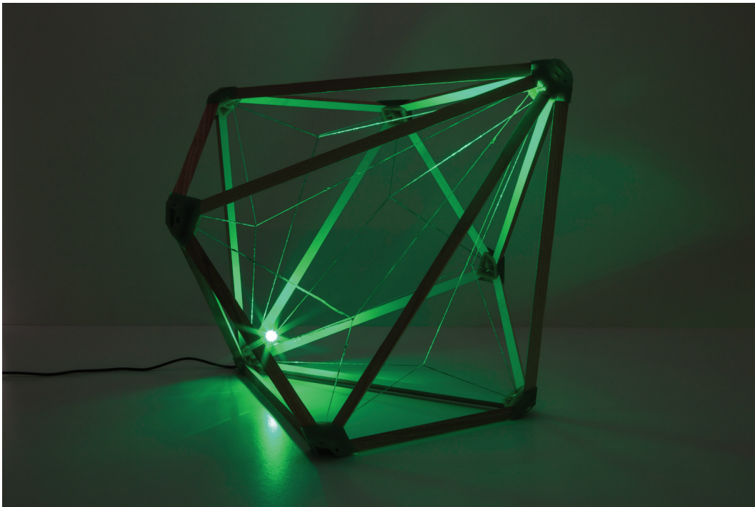
Olafur Eliasson Green light , 2016 Holz; recyceltes Plastik, Nylon und Kunststoff; LED (grün); Kabel 35 x 35 x 35 cm

Ausstellungen / Exhibitions Scherzergasse 1A, 1020 Wien +43 1 513 98 56 24 augarten@tba21.org tba21.org