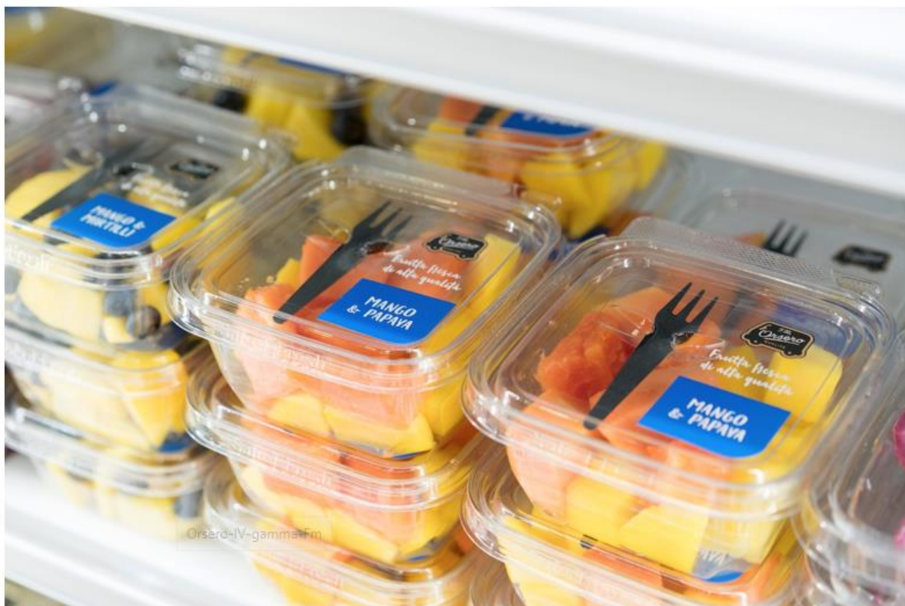
Le vaschette di frutta di quarta gamma F.Ili Orsero a Fruit Logistica 2019

Glebb & Metzger l'impresa di comunicazione