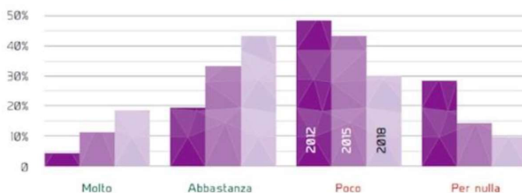
Quanto è importante la marca nella scelta di frutta e verdura?

In particolare, dal 2012 si nota una netta crescita di coloro che considerano la marca molto o abbastanza importante ; infatti, chi ha risposto "molto importante" è passato dal 4 al 18% di quest'anno, mentre chi ha risposto "abbastanza" è passato dal 19 al 43% (vedi figura sotto). Nella scelta di frutta e verdura, poi, l'importanza della marca aumenta progressivamente in base al numero di figli minorenni in famiglia (dal 57% di chi non ha figli al 69% di chi ne ha due).