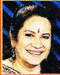
माँ प्रेम ऋतंभरा