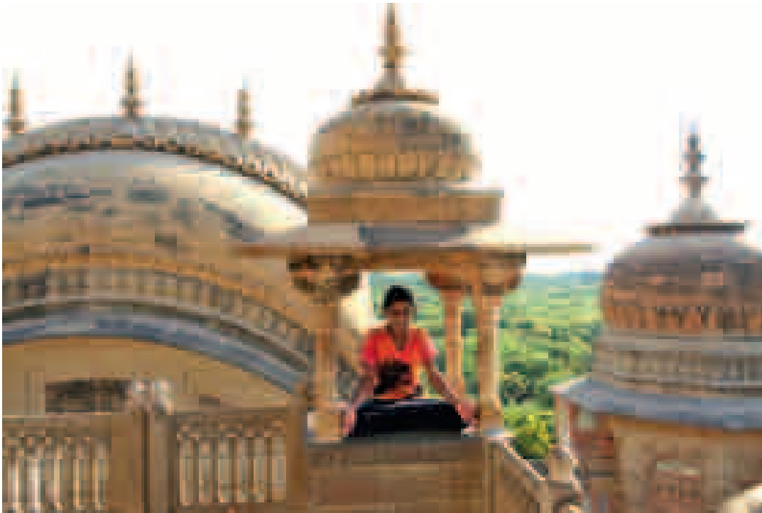
Kaoksen ja hulinan keskellä Devi sanoi rauhan olevan parasta Intiassa. Meditaatiossa mieli tyyntyi oltiin sitten maharajan palatsin huipulla tai ruuhkaisen junan käytävillä.