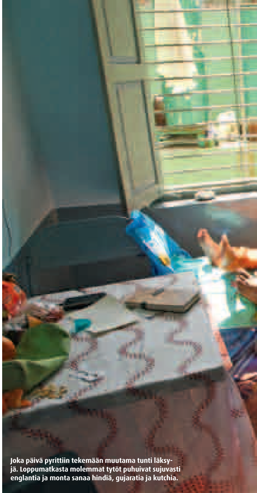
Joka päivä pyrittiin tekemään muutama tunti läksyjä. Loppumatkasta molemmat tytöt puhuivat sujuvasti englantia ja monta sanaa hindiä, gujaratia ja kutchia.

Muistan, kuinka kerran jäimme sinne jumiin, kun apinaparvi tuli syömään tamarindeja. Kyyhötimme ma-