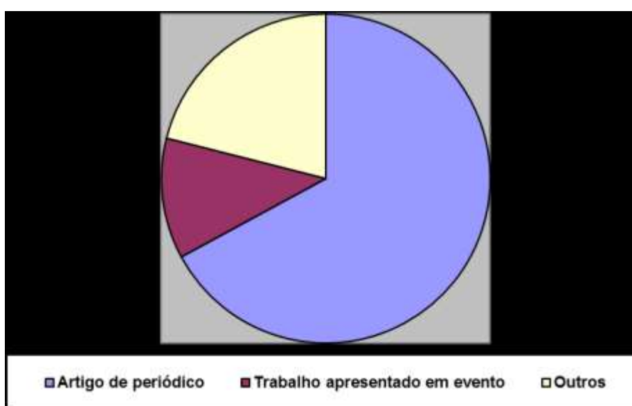
GRÁFICO 2 – Distribuição de documentos por tipo

Quanto ao tipo de publicação, verifica-se que a maior parte dos documentos é de artigos de periódico (67%), seguidos pelos trabalhos apresentados em eventos (12%). Outros tipos de publicação, tais como artigos de jornal, preprints , apresentações, cartas, editoriais e ensaios, somam 21% da amostra (Gráfico 2). A prevalência de artigos de periódicos na amostra reflete a composição das fontes selecionadas – a maioria dos itens vem da base Scopus , composta majoritariamente por documentos formais. A presença de preprints , apresentações e similares se justifica pela inclusão de fontes como arXiv e eLIS , que abrangem documentos informais.