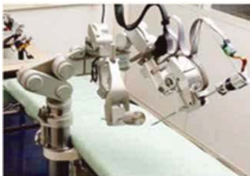
Şəkil 4. Yerləşdirilə bilən robot üç qollar single-site robot sistemi

Bununla birlikdə, sistem hələ də inkişaf etmiş sınaq mərhələsindədir. Eynilə, R-LESS üçün hazırlanmış robot end effektləri (YRUK-a daxil edilə bilən robot son effektləri) üçün platforma Kolumbiya Universiteti tərəfindən tərtib edilmişdir (Şəkil 4). On beş mm kəsiklə qarın içərisinə yerləşdirilə bilən YRUK platformasının fərqləndirici xüsusiyyətləri; İki seqmentə bölünməyən paralel kinematik quruluşda çox yüksək maneə qabiliyyətli qollara malikdir və ümumi çəkisi cəmi 8,2 kq-dır. Hal-hazırda heyvan modelləri üzərində sınaq mərhələsində olan sistem gələcəkdə R-LESS üçün olduqca perspektivli olaraq qalır (12, 13).