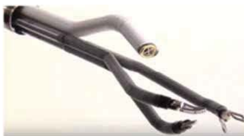
Şəkil 3. Da Vinci tək saytlı robot sistemi