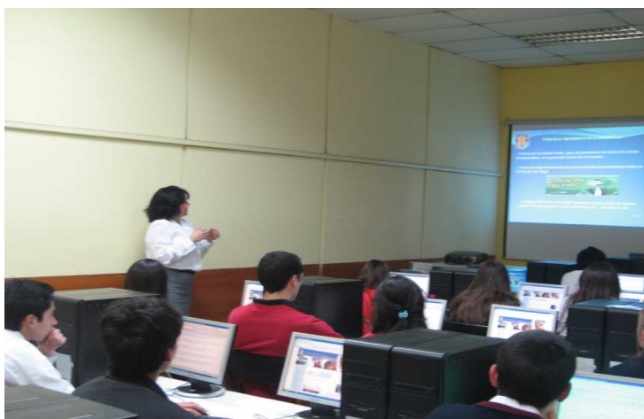
ILUSTRACIÓN 5. 1er. ALFIN Colegio Seminario Padre Alberto Hurtado de Chillán 2010

Actualmente la Universidad de Concepción promueve la formación de profesionales socialmente responsables que implica la existencia y aplicación progresiva de un modelo educativo validado para la formación en la competencia de “actuar con responsabilidad”.