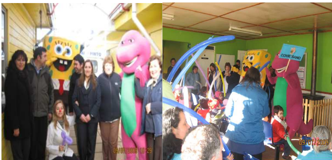
ILUSTRACIÓN 3 Equipo de trabajo Biblioteca UdeC, Campus Chillán, en el CESFAM Pinto.

La actividad, contó con el apoyo de la Dirección del CESFAM, con la alegría de su personal y con la aceptación de los pacientes.