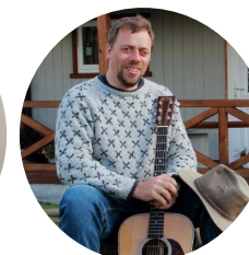
Svein i Prestgardi