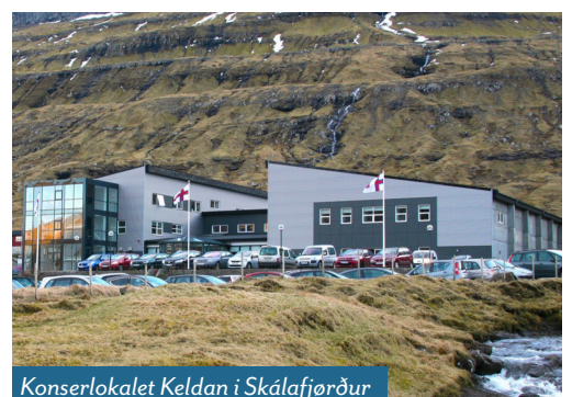
Konserlokalet Keldan i Skálafjørður