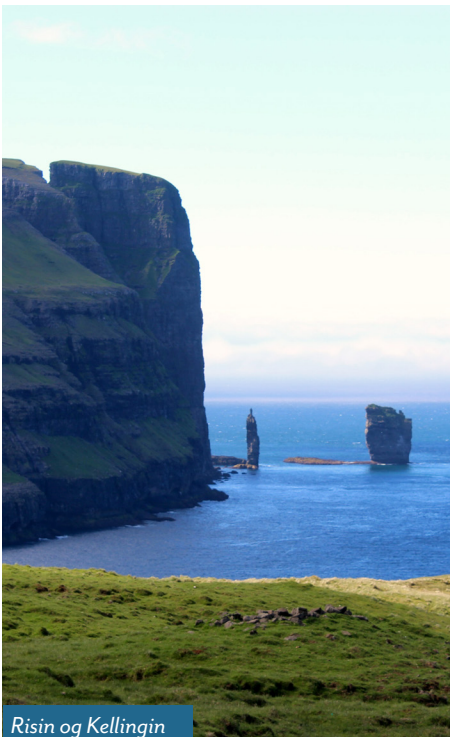
Risin og Kellingin

Lørdag: Halvdagsutflukt til den nordlige delen av Færøyene. Fra Tórshavn kjører vi nordover til Gøta, hvor vi tar et kort stopp på Blásastova, før veien går videre mot Klaksvík. Snart stuper du inn i 6.186 km lang undersjøisk tunnel som dukker opp i byen Klaksvík, hovedstaden i nord. Klaksvík er den nest største byen på Færøyene, og livsgrunnlaget her er hovedsakelig fiske. Flere nordmenn som flyktet under 2. verdenskrig kom hit. I Klaksvík vi besøker den praktfulle Christians kirke. Her vil du se en robåt i full størrelse festet til taket. Denne ble brukt av presten for å besøke de mange landsbyene i prestegjeldet. Lunsj serveres på en lokal kafé Amarant. Vi drar rett på konsert etter utflukten. Pris for utflukten 950,- inkl. lunsj