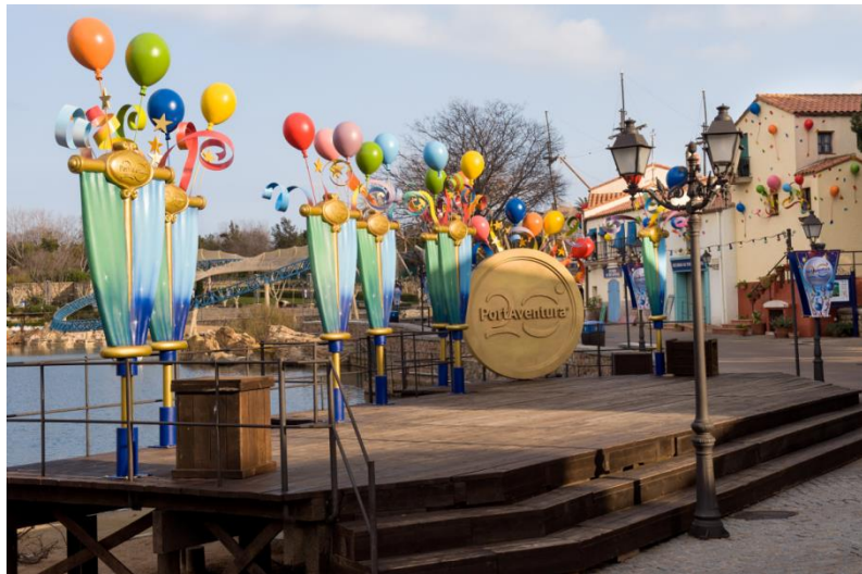
Detalles de tematización 20 aniversario