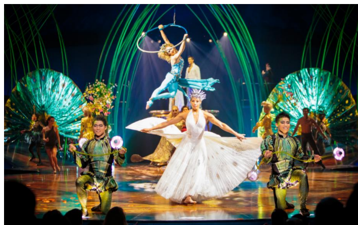
Amaluna – Cirque du Soleil

Fue el 1 de mayo de 1995 cuando comenzó todo. PortAventura abrió sus puertas para acoger a millones de visitantes de todo el mundo y convertirse en una referencia de ocio y diversión en el sur de Europa para toda la familia. A lo largo de 20 años, más de 60 millones de personas han disfrutado de la emoción de PortAventura y sus personajes.