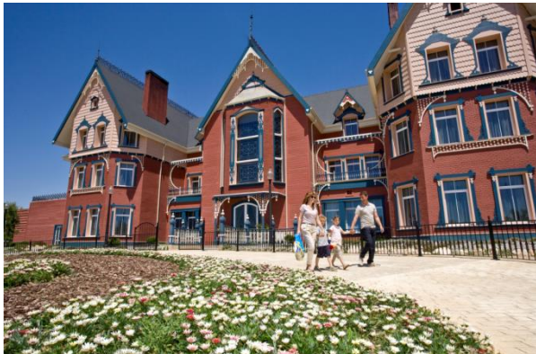
Hotel Mansión de Lucy

Con una inversión de 10 millones en proyectos hoteleros, PortAventura afianza su estrategia de expansión internacional y refuerza su apuesta por captar clientes del segmento Premium. Así lo demuestran la transformación de la Mansión de Lucy en el primer hotel 5 estrellas del resort que abrirá sus puertas el 2 de abril, y la ampliación del Hotel Gold River con el Edificio Callaghan , que incorpora 78 nuevas habitaciones de perfil Deluxe.