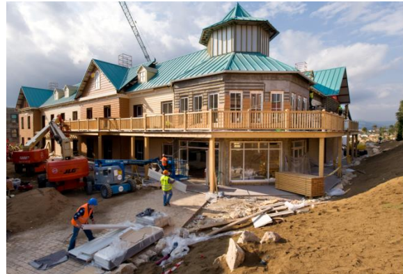
Nuevo edificio Callaghan

Además, el 7 de mayo se pondrá la primera piedra del espacio temático Ferrari Land , dedicado íntegramente a la mítica marca italiana y en exclusiva para toda Europa. Este proyecto supondrá una inversión de 100 millones de euros y refleja una vez más la apuesta de PortAventura por atraer nuevos perfiles de clientes y potenciar las visitas internacionales.