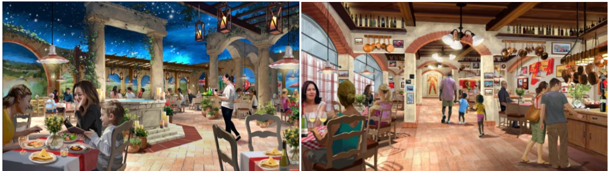
Imágenes de los futuros restaurantes de Ferrari Land

Ferrari Land será un nuevo parque temático dedicado al Cavallino Rampante que se sumará a la oferta de PortAventura World Parks & Resort convirtiéndolo en el destino europeo con un mayor número de parques temáticos (3). Este nuevo parque dedicado a Ferrari prevé una inversión cercana a los 100 millones de euros. Ferrari Land ocupará una superficie de 60.000 metros cuadrados y dispondrá de diversas y emocionantes nuevas atracciones con un gran componente de tecnología y adrenalina, destinadas principalmente a familias y a los apasionados de la marca Ferrari de todas las edades. La finalización de la construcción de Ferrari Land está prevista para finales de 2016 y su apertura será en 2017. Este nuevo partnership entre Ferrari y PortAventura World Parks & Resort permitirá a este último reforzar su posición de liderazgo entre los destinos de ocio familiar de Europa y ofrecer a los visitantes una experiencia irrepetible. En este momento PortAventura World Parks & Resort recibe cada año cerca de 4 millones de personas, de los cuales cerca del 50% proviene del mercado internacional.