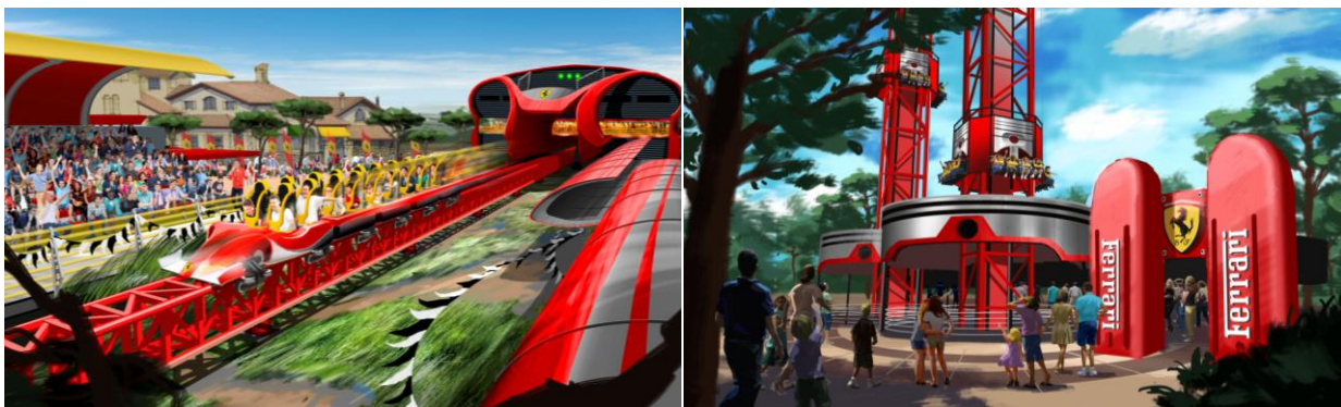
Vertical Accelerator Towers