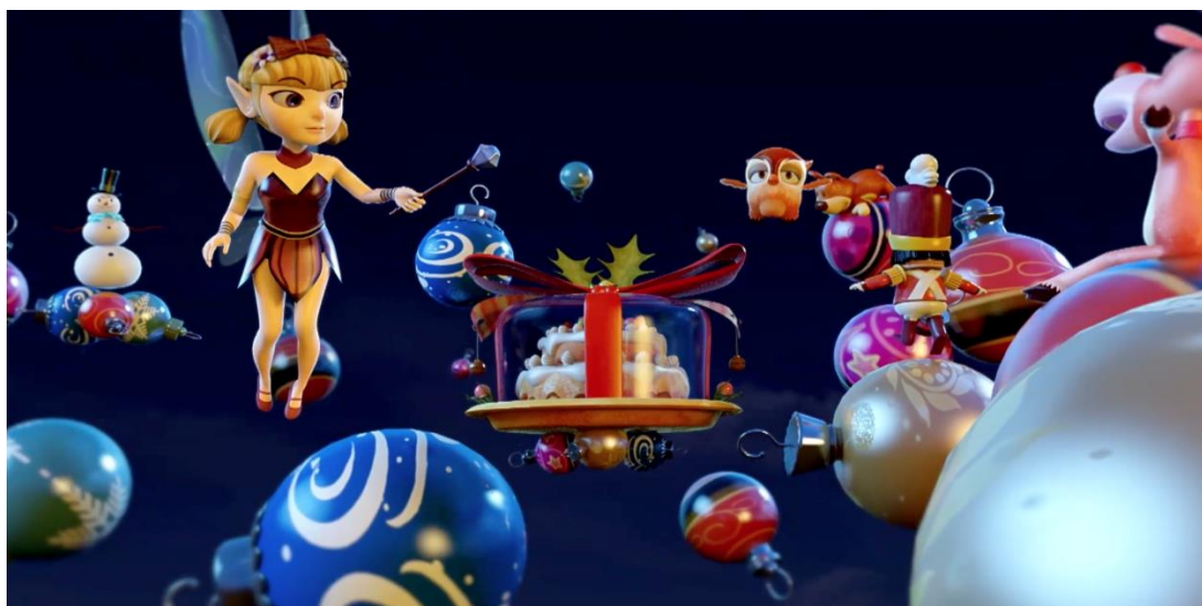
Новый фильм 3D Christmas Adventure

ПортАventura, 18 октября 2013 г. Начиная с 23 ноября, в ПортАventura проходит радостный и веселый сезон Рождества, который погружает малышей и взрослых в яркую праздничную атмосферу. Семнадцать ежедневных представлений, созданных специально для этого времени года, восхитительное освещение, елки и традиционные новогодние украшения, все это идеальные ингредиенты для сказочного отпуска и незабываемых детских каникул.