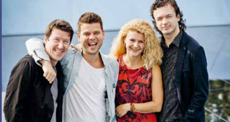
Pavel Haas Quartett