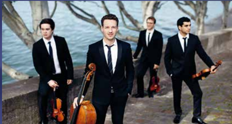
Quatuor Van Kuijk