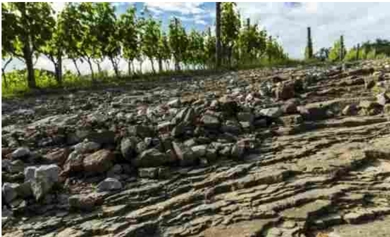
Il terreno argilloso del Monte Calvario

Podversic è contadino vero, mani grandi come mattoni e faccia aperta al vento del Collio. Ha una moglie tosta, con cui condivide la causa della buona terra, e due figli adolescenti, entrambi con un debole dichiarato per le pratiche della viticoltura naturale . "Sono sorpreso da questo premio, non me l'aspettavo. All'inizio quasi non volevo accettarlo, perché sono cose molto importanti, di livello internazionale. Poi ho pensato che potevo accettarlo e condividerlo con il gruppo dei produttori di Oslavia, dedicarlo ai miei maestri, a Josko Gravner ".