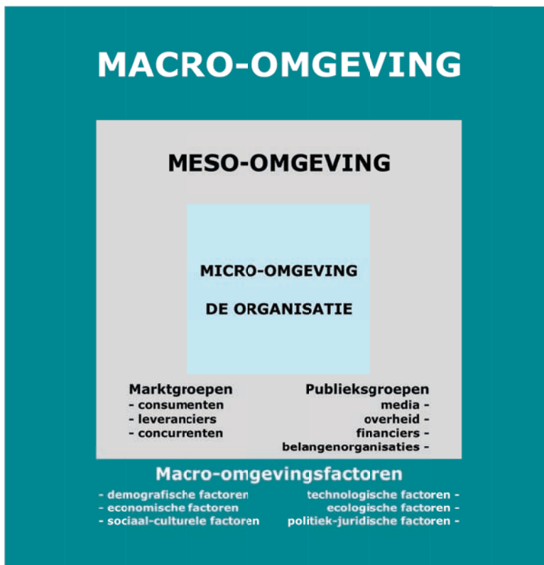
Figuur 2: De marketingomgeving.

Beïnvloedbare beleidsbepalende factoren zijn omstandigheden die je als retailer kunt beïnvloeden en die je dus in jouw commercieel beleid naar eigen inzicht en goeddunken kunt aanpassen. Dit speelt zich af binnen de micro-omgeving.