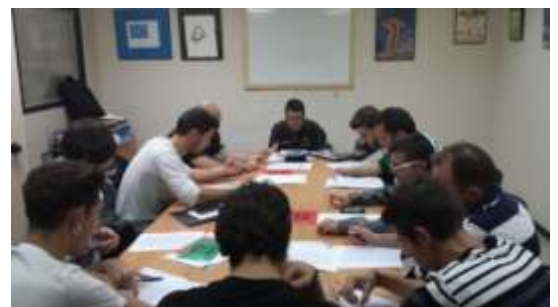
També el dia 15 de novembre, a Amposta, es va fer una xerrada formativa pels àrbitres d'escola, de les terres de l'ebre.