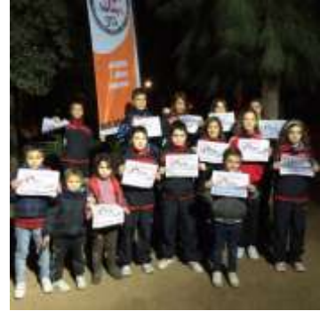
La quitxalla del CB CANTAIRES també va donar suport a la Marató de TV3.