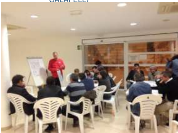
El Club Bàsquet Altafulla, va fer una xerrada dirigida a pares i aficionats, sobre la tasca d'annotador i cronometrador de partits. Felicitats per la iniciativa!