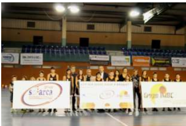
Coincidint amb la presentació de l'equip, el CB La Selva va presentar les seves beques "Cap nen sense jugar a bàsquet", patrocinades per Solarca, la Fundació La Caixa i TMBC.