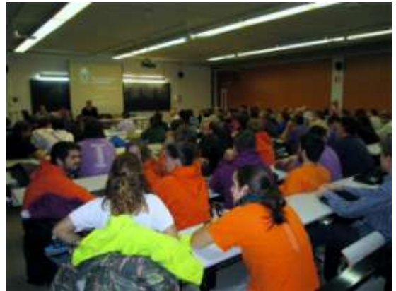
El dilluns 1 de desembre, a la Universitat Rovira i Virgili, es va informar als tècnics del procés d'homologacions de títols