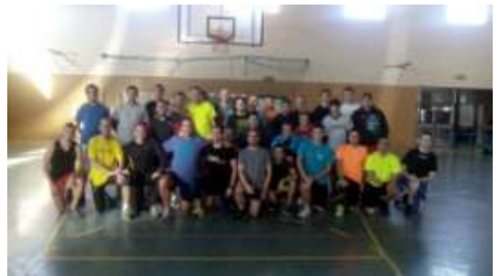
Els àrbitres del comitè territorial, van fer els test de proves físiques, el dissabte 15 de novembre, a les instal·lacions de La Salle de Tarragona.