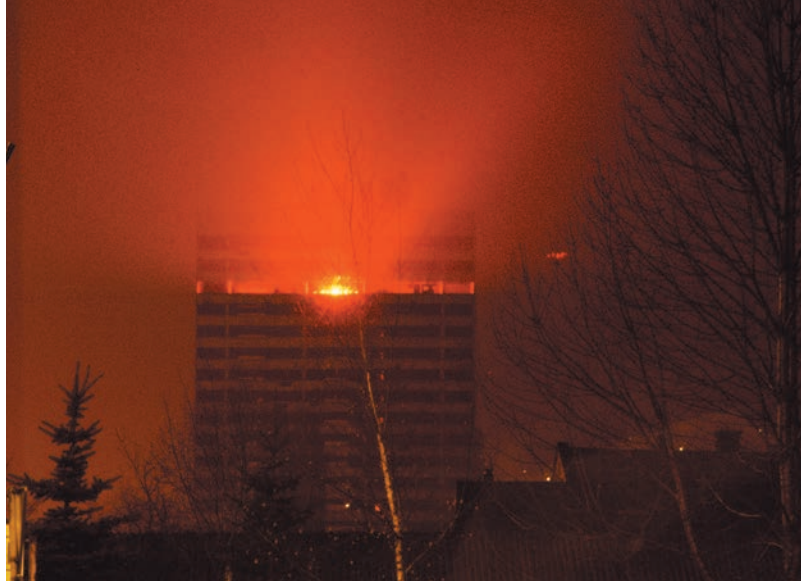
Dal Tramonto all'Alba , 2006. Intervento luminoso, XXII International Festival "Sarajevska Zima", Torre del Parlamento, Sarajevo, Bosnia-Erzegovina, 7 febbraio 2006.

La notte del 7 febbraio 2006 l'artista posiziona all'interno dell'ultimo piano alcuni fari Fresnel per creare una luce potentissima, simulando artificialmente il passaggio dal tramonto all'alba. Nonostante sia fisso, il fascio di luce arancione è percepito come in movimento da chi si sposta da un luogo all'altro della città, conferendo all'edificio una funzione di meridiana e generando una dicotomia tra l'asse verticale e la linea dell'orizzonte. Questa