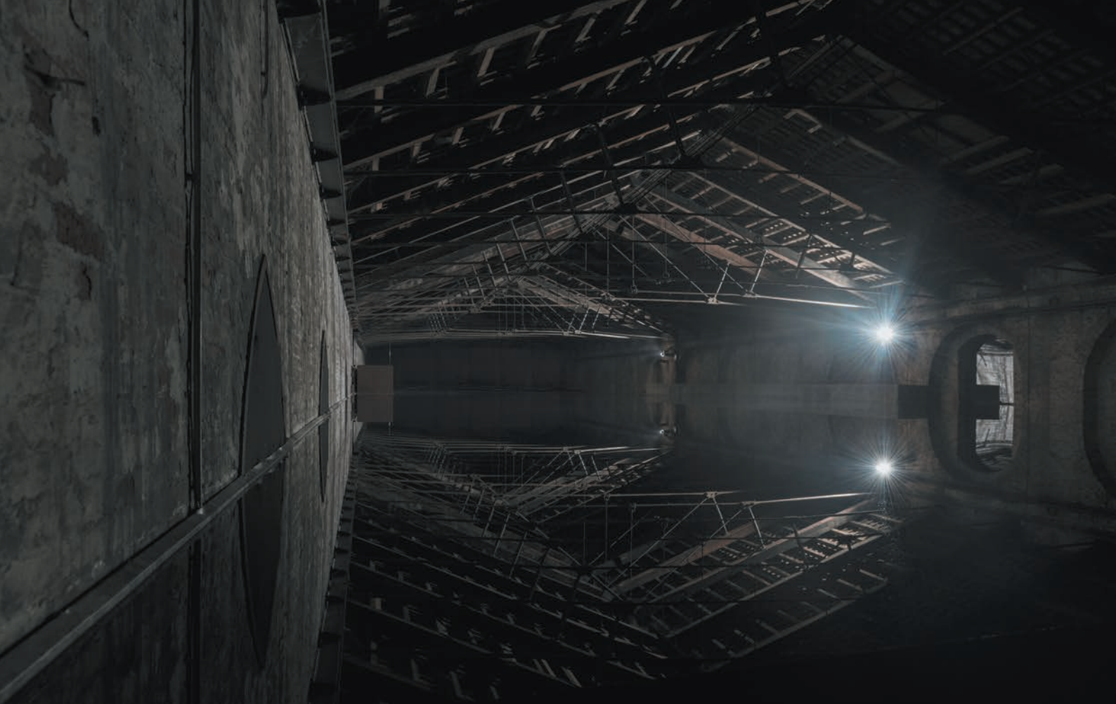
Senza titolo ( La fine del mondo ), 2017. Veduta dell'installazione, Padiglione Italia, 57ma Biennale di Venezia, 2017.