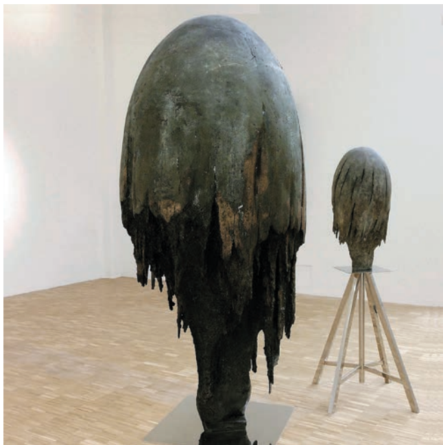
Medusa (B) , 2015 (in primo piano) e Medusa (A) , 2015. Veduta dell'installazione, Triennale di Milano, 2015.

titolo richiama un saggio sul cinema scritto dal regista russo Andrej Tarkovskij (1932-1986).