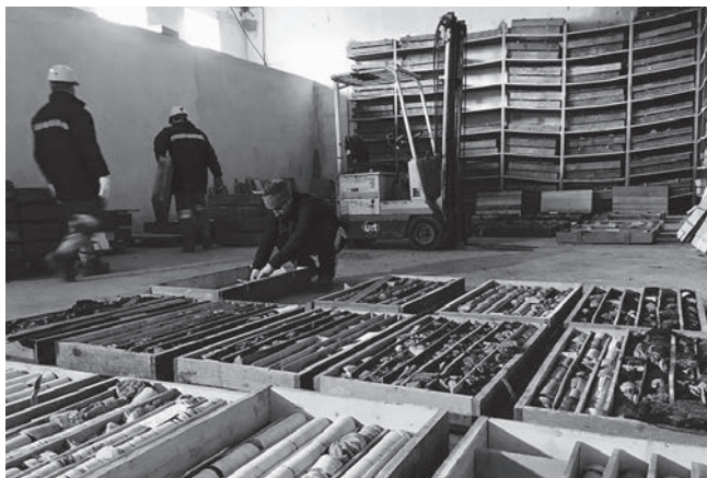
Archivio carotaggi Carbosulcis, Nuraxi Figus, Sardegna, 2019. Documentazione fotografica.