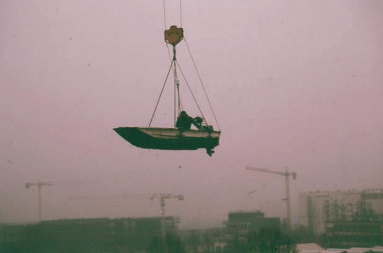
Volver , 2008. Documentazione fotografica dell'azione, Milano, 2008.

al tetto dove era esposta la barca stessa, sezionata esattamente a metà e adagiata su una superficie d'acqua. Grazie ai riflessi si veniva a creare un effetto ottico per cui le due metà dell'imbarcazione sembravano ricomporsi e sdoppiarsi.