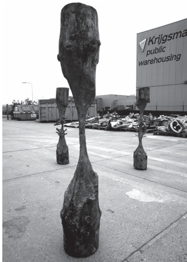
Scolpire il Tempo , 2010. Bronzo, 3 elementi, dimensioni varie.

L'opera viene ulteriormente elaborata da un punto di vista formale dall'artista, che produce due esemplari identici in cera e li unisce in maniera speculare, creando poi una scultura in bronzo con il procedimento della fusione a cera persa. Il titolo del lavoro fa riferimento alla caratteristica forma ottenuta dalla composizione simmetrica dei due elementi e richiama lo scorrere del tempo, inteso da Andreotta Calò come elemento scultoreo e materia da plasmare. In riferimento a questa tematica, tre delle opere della serie esposte in mostra costituiscono il trittico Scolpire il Tempo (2010), il cui