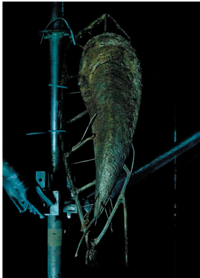
Senza titolo ( La fine del mondo ), 2017. Particolare di una Pinna Nobilis , Padiglione Italia, 57ma Biennale di Venezia, 2017.

La forma simmetrica degli esemplari bivalve da cui nasce la serie Pinnae Nobilis richiama il tema del doppio e l'idea di specularità che ricorrono nel lavoro dell'artista, in particolare in relazione al fenomeno del rispecchiamento del paesaggio tipico della laguna. L'opera rimanda anche a temi inerenti ai cambiamenti ambientali avvenuti negli ultimi anni nella laguna di Venezia, dove si è assistito al ripopolamento di questa specie a seguito delle alterazioni dell'ecosistema connesse al progetto Mose (Modulo Sperimentale Elettromeccanico), che consiste nella costruzione di paratie mobili per contenere gli effetti dell'alta marea.