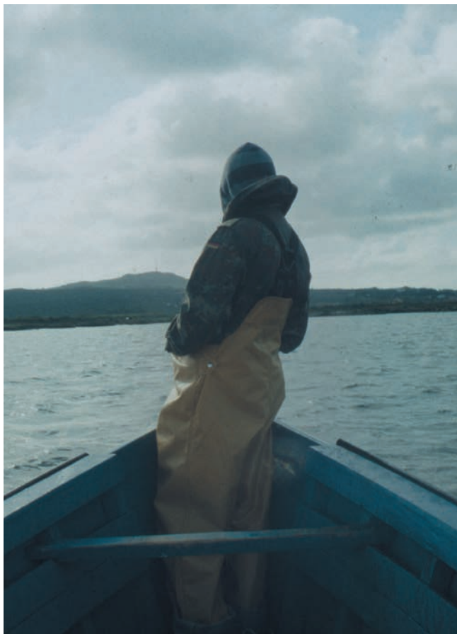
Giorgio Andreotta Calò, Sardegna, 2014. Documentazione fotografica su pellicola 35mm per In Girum Imus Nocte , 2014.