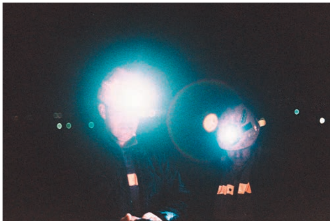
In Girum Imus Nocte , 2014. Documentazione fotografica su pellicola 35mm, Sulcis Iglesiente, Sardegna, 2014.

sfumature visibili sulla superficie dei Carotaggi variano infatti in funzione della tipologia di materiale e del livello di profondità di estrazione. Alcuni tra questi sono adagiati all'interno di tubi o semi-cilindri in PVC e in metallo, impiegati originariamente per l'estrazione del materiale.