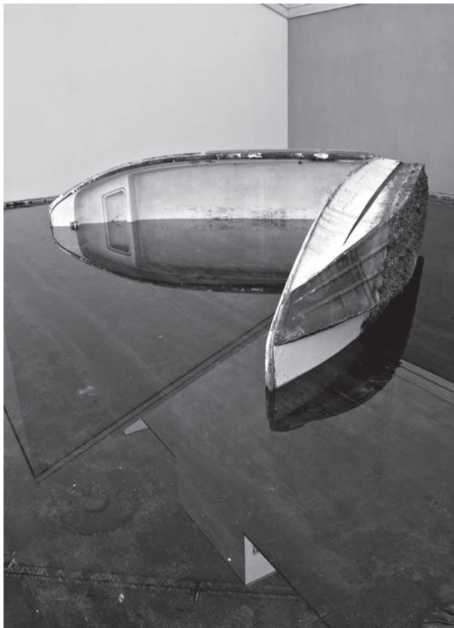
Volver , 2008. Barca, acqua, neon, 73 x 400 x 400 cm. Veduta dell'installazione, Galleria ZERO..., Milano, 2008.

Pirelli HangarBicocca è una fondazione no profit nata a Milano nel 2004 dalla riconversione di uno stabilimento industriale in un'istituzione dedicata alla produzione e promozione di arte contemporanea.