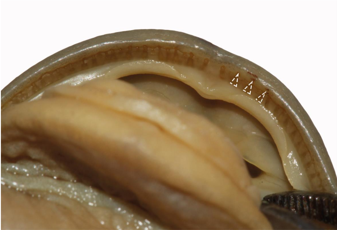
Figure S1. Ventral view of the mouth of a male of Plectrohyla guatemalensis (USAC 45332). A few long and pointed teeth are digitally delimited by white broken lines.

List of species studied (all males unless specify): Plectrohyla chrysopleura USNM 514405 (♀), USNM 514406; Plectrohyla dasypus USNM 514409, USNM 514411, USNM 514412, USNM 514413, USNM 514414 (♀), USNM 514415, USNM 514416, USNM 514417, USNM 514419; Plectrohyla glandulosa MCZ A-55236, MCZ A-55237, MCZ A-55238; Plectrohyla guatemalensis USNM 343475 (♀); USNM 343478, USNM 343487, USNM 343490, USNM 343509, USNM 343511, USNM 343516, USAC 45332 ; Plectrohyla matudai MCZ A-2651(♀), MCZ A-55319, MCZ A-55320, USNM 514421; Plectrohyla sagorum MCZ A-24538, USNM 111122, USNM 111125 (♀); Ptychohyla euthysanota MCZ A-34997; Ptychohyla hypomykter USNM 343526, USNM 343530, USNM 343566, USNM 580114; Ptychohyla leonhardschultzei MCZ A-55298, MCZ A-55299, MCZ A-55300, MCZ A-55301, MCZ A-55302 MCZ A-55303, USNM 266248.