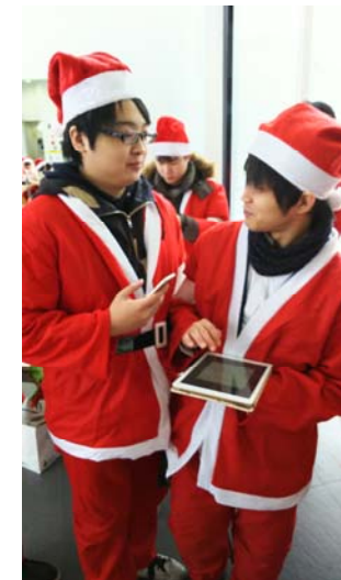
* 2017稚内北星サンタラン